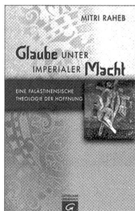
Mitri Raheb, Glaube unter imperialer Macht. Eine palästinensische Theologie der Hoffnung, Gütersloher Verlagshaus, Gütersloh 2014, 224 Seiten.

Erklärungsansätze im Buch sind gültig auch für die Auseinandersetzung in der gesamten arabischen Welt. Palästina war die bisherige Kampfarena der regionalen Mächte. Durch den sogenannten Arabischen Frühling hat sich die Kampfarena erweitert. Der Libanon gehört – einmal mehr – wieder dazu, vor allem aber der Irak und Syrien. Beinahe wurde auch Ägypten Teil davon, es scheint sich derzeit aber mehr oder weniger heraushalten zu können. Jetzt üben die regionalen Mächte – zusätzlich zu den USA, Russland, Iran, neu die Golfstaaten, die Türkei, Saudiarabien, Israel – in einer erweiterten Kampfarena ihre Macht aus.