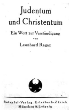
Pioniertat für den jüdisch-christlichen Dialog, Ragaz' Vortrag von 1921.

Die Aussage ist zu griffig, um wahr zu sein. Ragaz räumt denn auch ein, sie sei «zugespitzt ausgedrückt» und jedenfalls eine «nicht gar zu stark zu pressende Formel». Auch nimmt sie Jesus als den Messias vorweg, sonst würde sie in ihrer