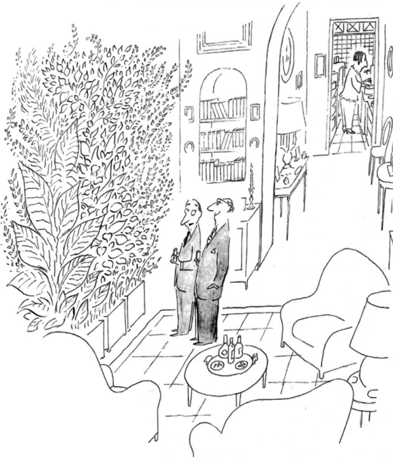
Cartoon: Jean-Jacques Sempé

Nun haben beispielsweise die Erste und Zweite Frauenbewegung gezeigt, dass sie gerade als Bewegungen zu einer Art «historischer Marsch» zwecks Einholen der Männer in ihrem sozialen Fortschreiten wurden und dass die Emanzipation der Frauen zwar das Wahl- und Stimmrecht, Bildungschancen und eine gewisse Freiheit in der Wahl des Berufs und des Lebensentwurfes eröffnet hat. Die Frauen haben tatsächlich nennenswerte Fortschritte in der politischen Gleichstellung erreicht. Es ist aber auch eine Integration der Frauen in die herkömmliche Ordnung des Patriarchats. Eine Integration auf Kosten der Geschlechterdifferenz und der Eigenständigkeit, kurz: der weiblichen Freiheit.