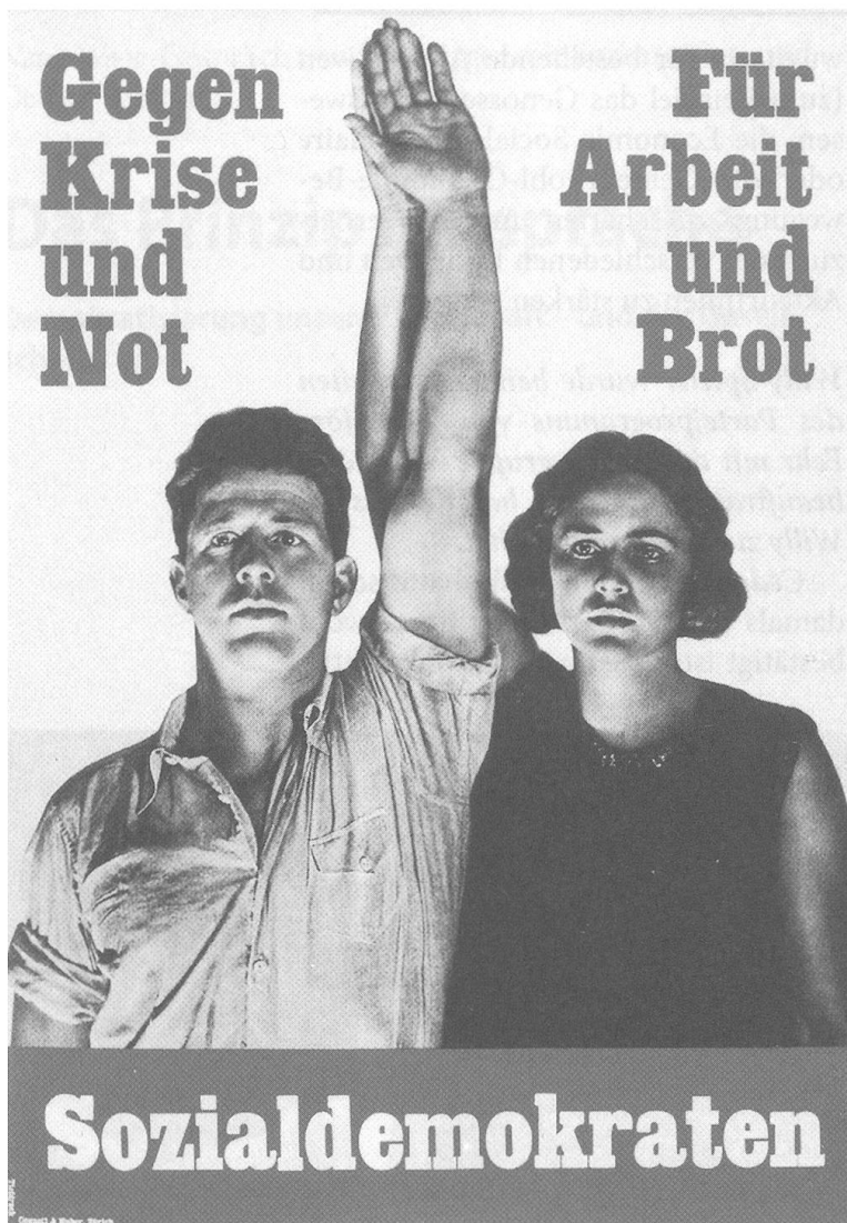
Plakat zu den Nationalratswahlen 1931 von Paul Senn. Es ist das erste politische Fotoplakat der Schweiz.

Wertegemeinschaft alle vereinen zu können. Das Papier zur Wirtschaftsdemokratie zeigt, dass dies bis zu einem gewissen Grad gelungen ist.