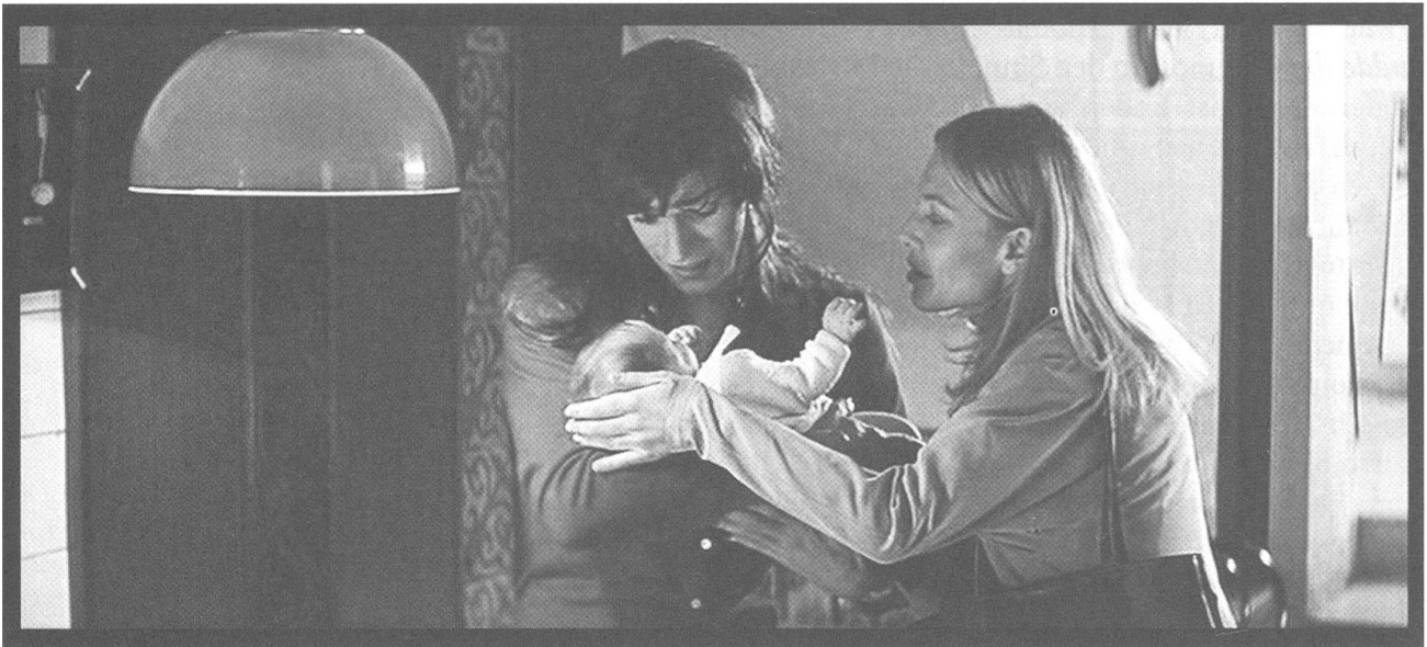
Der Transvestit Lola ist Vater und Mutter zugleich; Filmstill aus Todo sobre mi madre (Pedro Almodóvar, ES 1999).

Ja klar, zum Beispiel Terminator (James Cameron, US 1984) mit Arnold Schwarzenegger. Eigentlich ist Terminator ein Sciencefiction mit vielen apokalyptischen Verweisen. In solchen Genres, die auf eine Endzeit hin fokussieren, wird oft die Familie zur Hoffnungsträgerin. Sie ist die Garantin für die Zukunft. Hier ist das genau so: Der Terminator wird aus der Zukunft in die Gegenwart