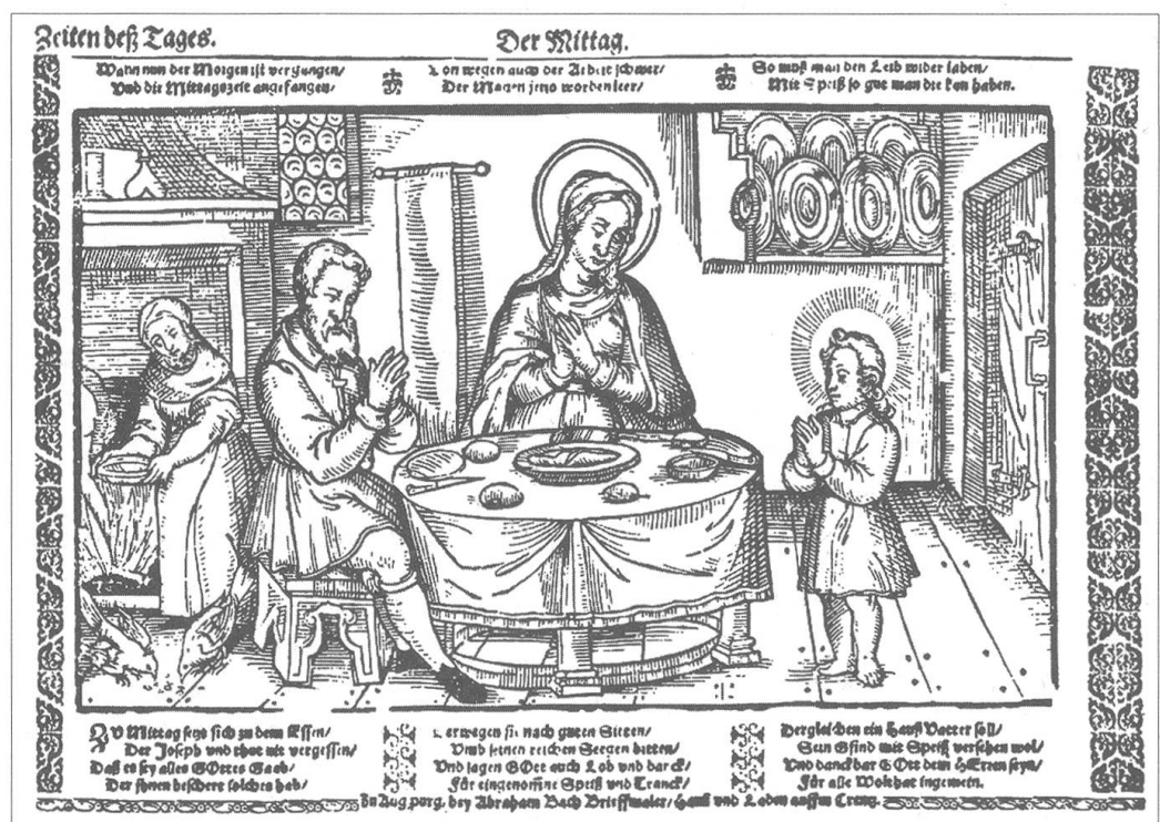
Die Tageszeiten mit der Heiligen Familie: der Mittag; Abraham Bach der Ältere, Germanisches Museum, Nürnberg.

komplexe Geschichte des Christentums wurde greif- und nachvollziehbar gemacht durch eine Mutterfigur mit Kind.