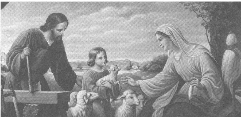
Die Heilige Familie bei der Arbeit, ca. 1930; Bauernhofmuseum Amerang.

Eine gute Frage. Das Problem ist, dass die Heilige Familie ein Ideal darstellt, das realistisch gesehen gar nicht lebbar ist. Die Grundkonstellation ist surreal: Vielleicht könnten wir dank der modernen Fertilitätsmedizin darüber diskutieren, ob jungfräuliche Schwangerschaft möglich ist. Aber dann gibt es immer noch das Problem mit dem Kind, das Sohn und Vater zugleich ist. Zugegeben, Josef ist da die unproblematischste Figur: Adoptivväter oder Patchwork-Väter finden wir überall. Die Heilige Fami-