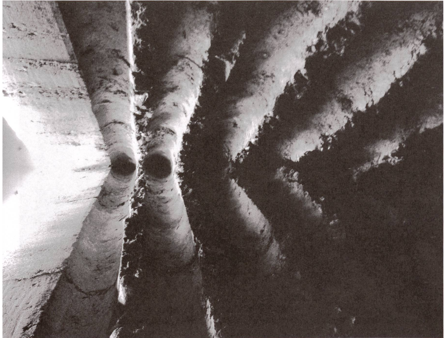
Abdruck von Fichtenstämmen im Stampfbeton beim Eingang der Bruder-Klaus-Kapelle.

2. Juni 2016 auch von Menschenrechten. Aber er setzt dann einen ganz anderen Akzent: «Die Schweiz ist ein christliches Land. Dazu sollten wir wieder stehen. Und wir sollten klarmachen, dass wir bereit sind, dieses Erbe zu verteidigen. Wer bei uns lebt, muss lernen, diese christlichen Werte anzuerkennen.» Was halten Sie von dieser Verwendung der «christlichen Werte», die zu einem Kampfbegriff gegen andere werden?