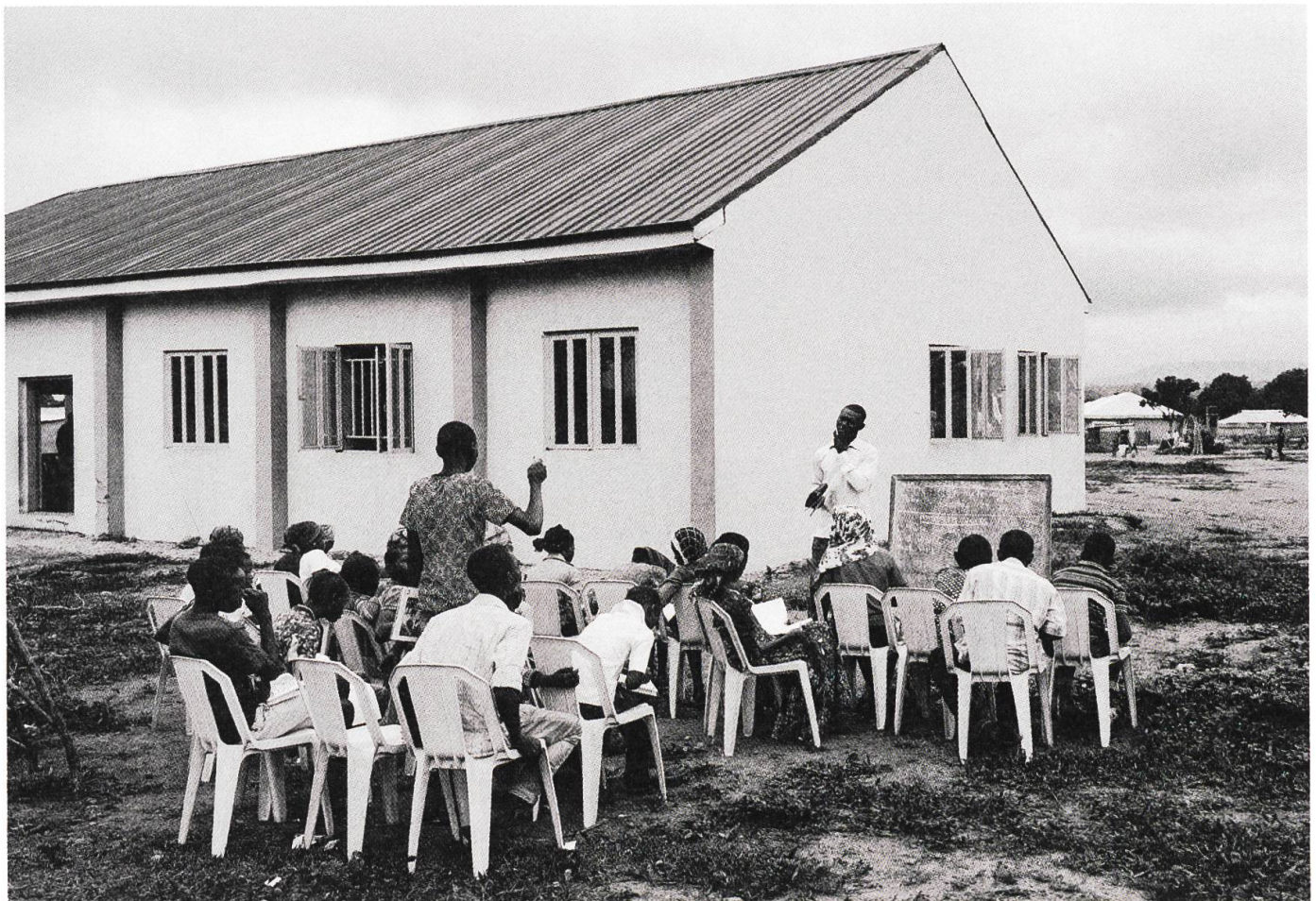
Nigeria 2017.

Sonntagmorgen im Flüchtlingsdorf Gurku: Bevor die Erwachsenen den Gottesdienst besuchen, gehen die Kinder und Jugendlichen zur Sonntagschule.