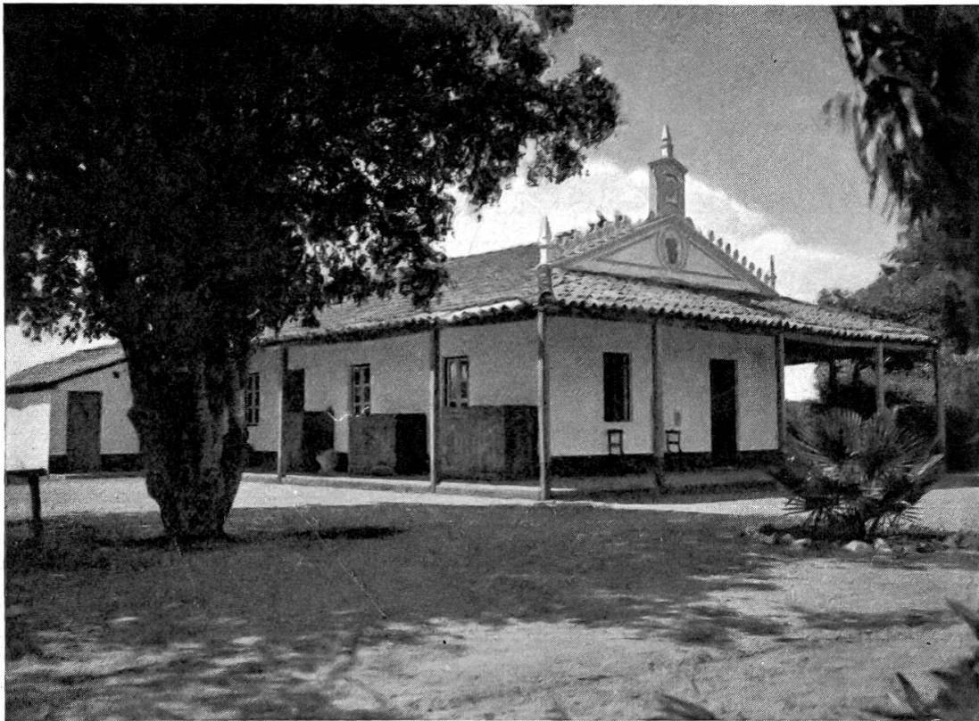
Abbildung 2: Wohnung des Leiters des Forstgartens in Joazeiro (Bahia).