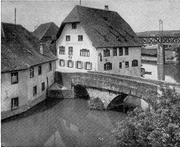
Abbildung 2. Ergolzbrücke in Augst.