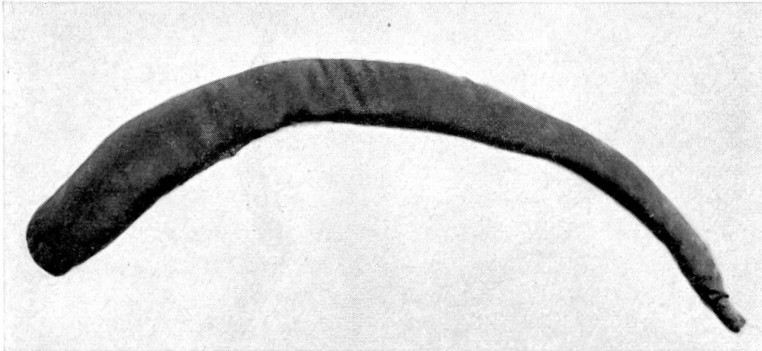
Abbildung 2. Modell zur Nachahmung der Wachstumsform.

Modell fehlt eben das Wachstum und die damit verbundene Bewegung. Ersetze ich die dem spiralförmigen Wachstum entsprechende Bewegung vor und während der Geradestreckung durch energische Drehung der Schnur, die der Unterkante des Horns entspricht, so kommt die Schraubenform im Modell recht deutlich – und wie mir scheint – überzeugend zustande (Abbildung 3). Dadurch wird die von mir geäußerte Ansicht bestätigt.