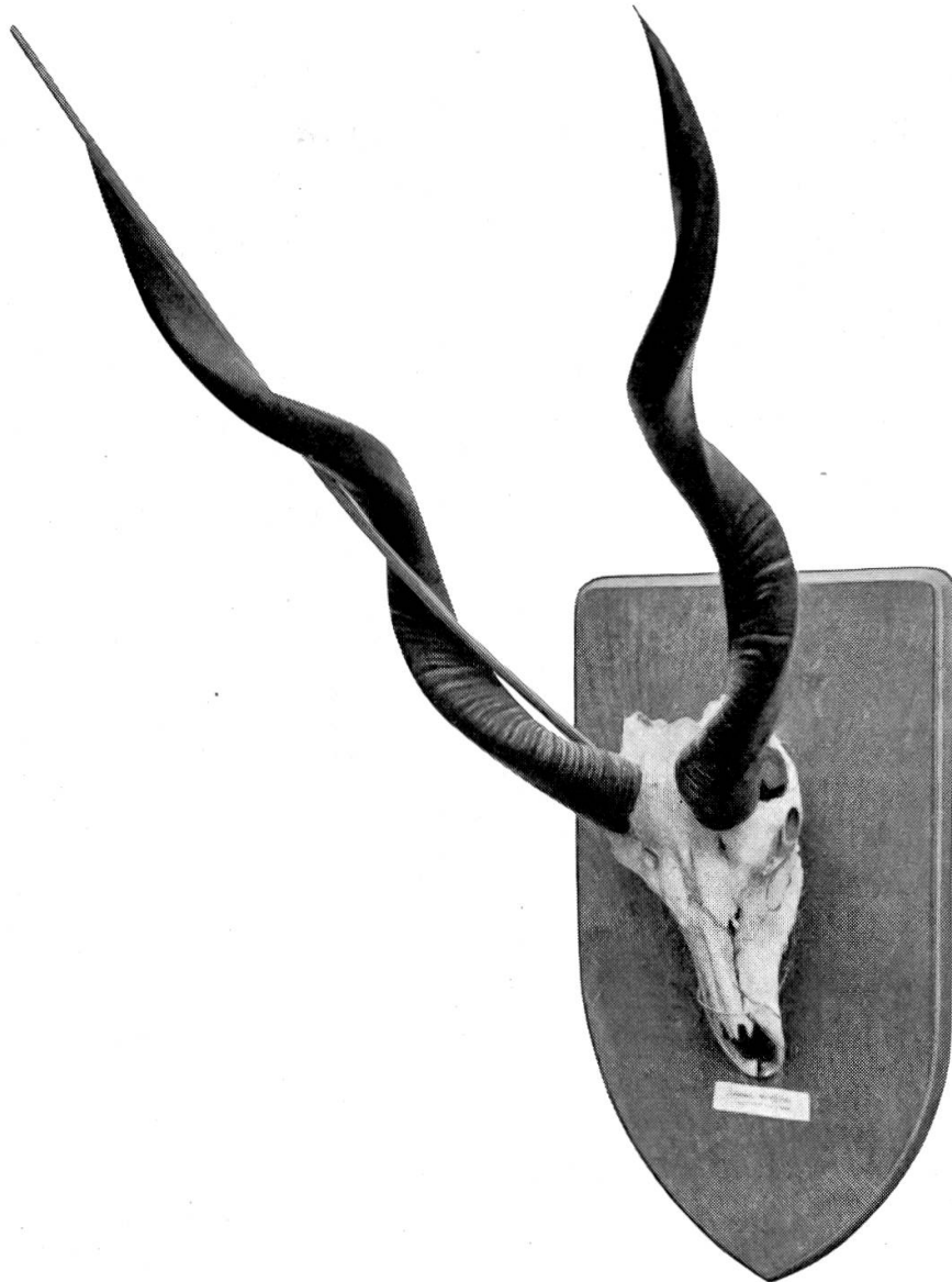
Abbildung 1. Gehörn der Kudu-Antilope. Die schmale erhabene Zone zieht sich in gerader Linie durch die Schraubenwindungen.

die früher gebogene und längere Oberkante der gebogenen Form erstrecken konnte, blieb nichts anderes übrig (es war das einfachste), als sich in einer ausgezogenen Spirale, d.h. als Schraubenlinie, um die eben beschriebene kürzere gerade Unterkante des Horns herumzulegen.