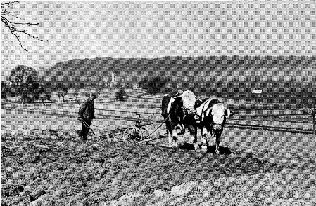
Abb. 14. Das Ochsespann mit dem linkswendenden Sundgaupflug (Holzkonstruktion) beim Wenden (SE Tagsdorf).

pflüge eingesetzt, die nicht wendbare, sondern einseitwendende Pflugscharen haben, die mit Mutterschrauben am hintern Traktorgestänge befestigt sind. Dadurch ist die Kontinuität des einseitwendenden Ackerbaugerätes gewährleistet. Trotz der technischen Möglichkeiten, die anders ausgenützt werden könnten, wird traditionsgemäss gepflügt, denn «man kann nur so pflügen, wie es schon immer gemacht wurde». Das unbewusste Beharren im Hergebrachten darf nicht unterschätzt werden. Dies zeigt sich auch daran, dass die Benennung der verschiedenen Pflügungen – jahreszeitliche und fruchtbedingte, Zusammen- oder Auseinanderfahren – durchaus noch verwendet werden (vgl. dazu BEYER, 1959, 499 ff., MITZKA, 1958, 115). Diese Begriffe, die ihre Bedeutung in der Agrarlandschaft mit Zugtieren und altem Pflug erlangt und besessen haben, werden vorderhand noch beibehalten und teilweise auf die technisierten Zustände übertragen.