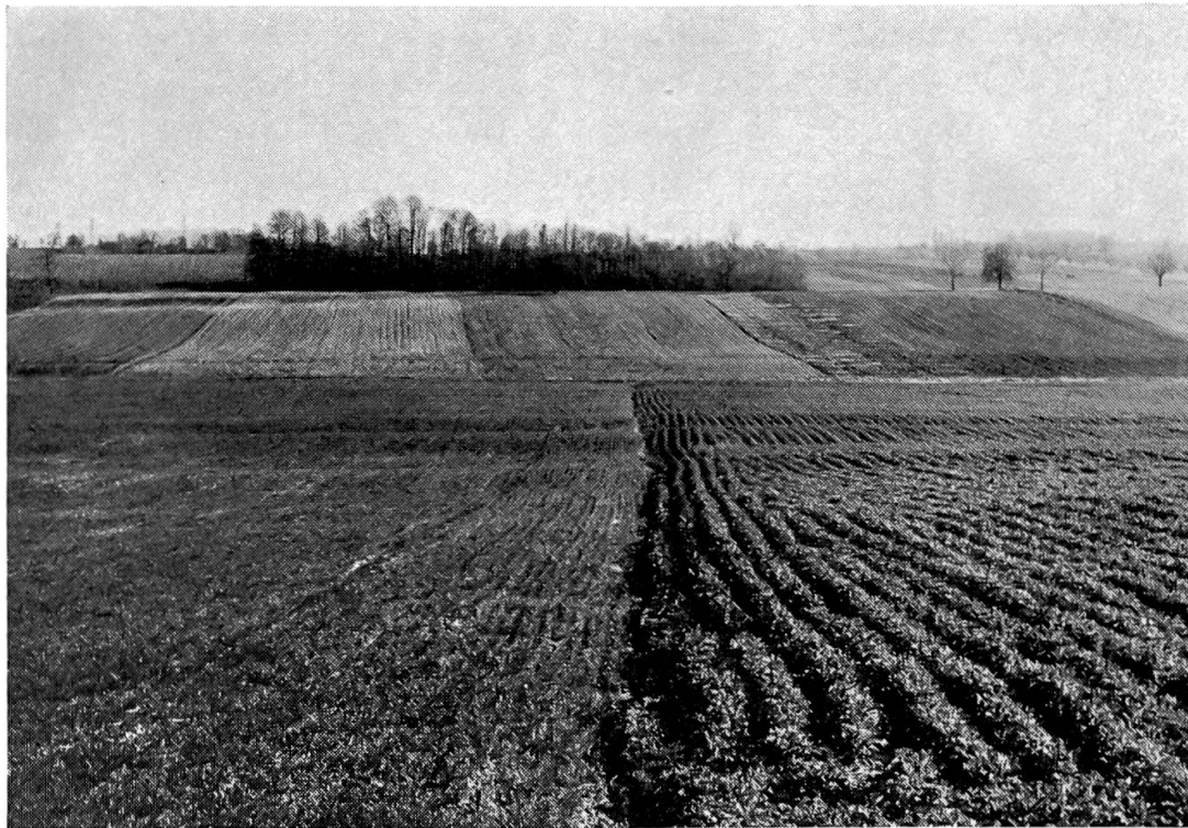
Abb. 15. Die Aufnahme wurde drei Jahre nach der Güterzusammenlegung gemacht. Die ehemaligen Wölbäcker sind im Mittelgrund zu erkennen. Sie laufen quer zu den neuen Parzellen.

1825 hingegen waren 1045 Besitzer vorhanden. Leute aus 29 verschiedenen Gemeinden besaßen Land in Rixheim (weiteres vgl. NICO, 1959, 61). Dabei ist zu berücksichtigen, dass Rixheim viele kleine Rebpar-