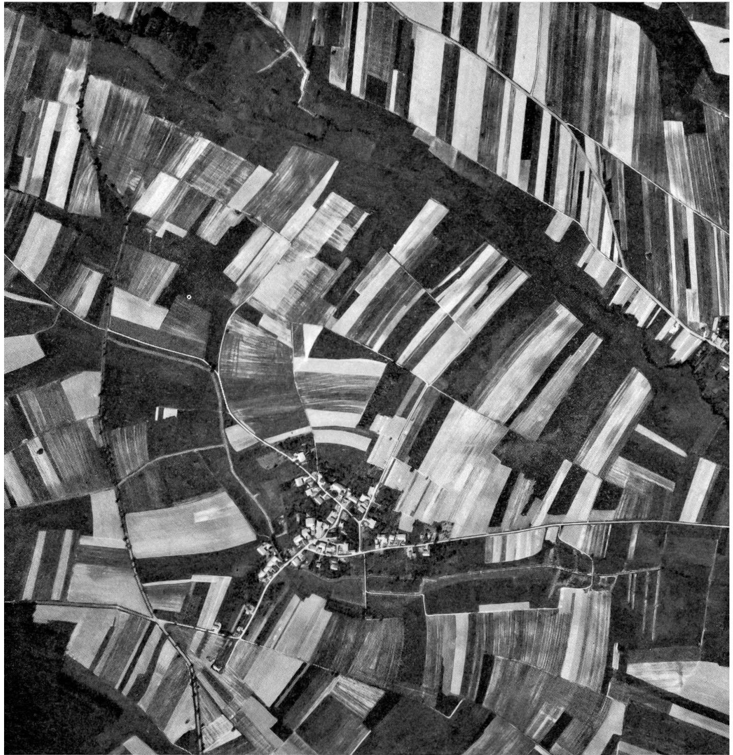
Abb. 18. Das Luftbild von Ammertzwiler aus dem Jahr 1966 zeigt die regulierte Flur (mit Bewilligung des Institut Géographique National, Paris).