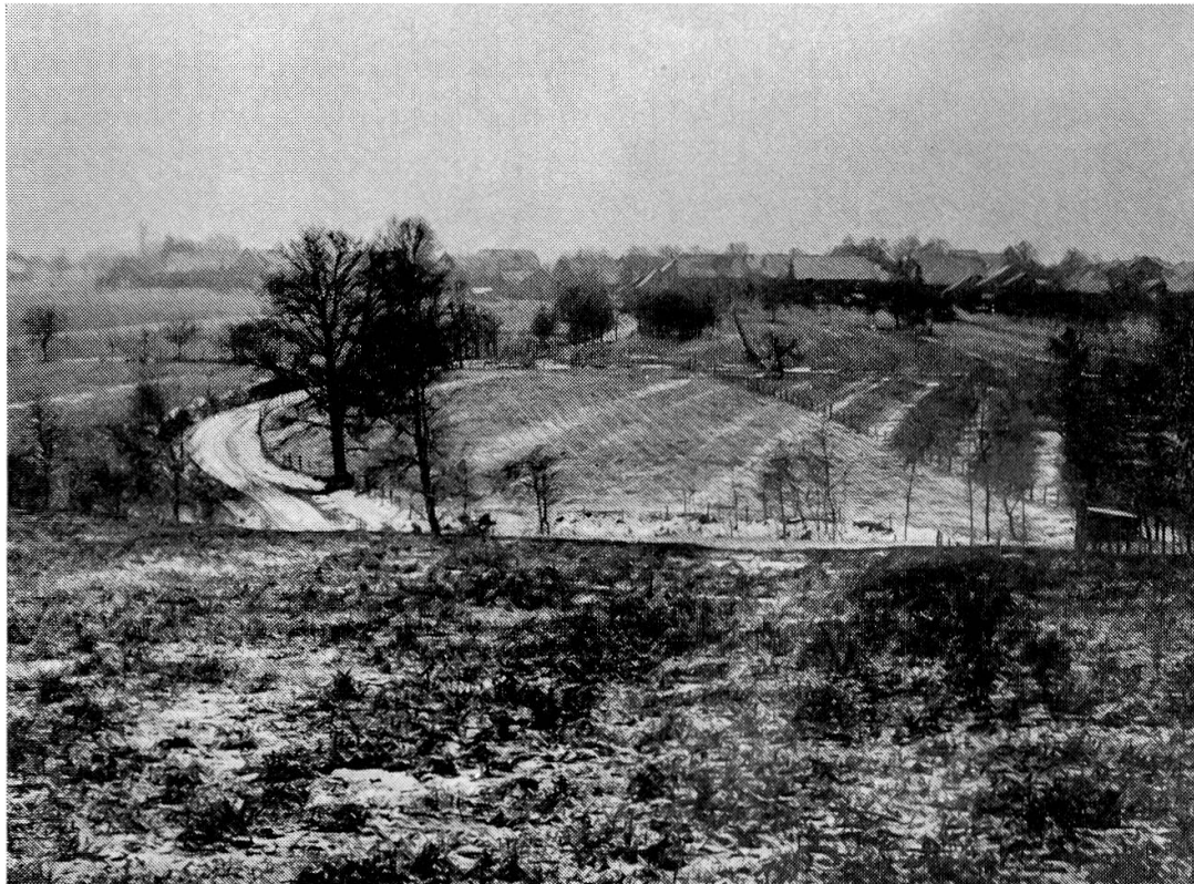
Abb. 16. Regulierte Flur bei Muespach-le-Haut. Da der Schnee in den ehemaligen Grenzfurchen länger liegen bleibt, sind die Wölbackerreste unter den neuen Parzellen zu erkennen.

tigkeit sein kann, weggearbeitet ist, wird in den nächsten Pflügungen immer wieder Bodenmaterial der unteren Profilhorizonte 109 aufgepflügt. Zwei Feststellungen folgen aus diesen Beobachtungen: Die Wölbacher wurden seit Jahrhunderten bearbeitet, so dass sich ein eigenes Bodenprofil entwickeln konnte. Dieses ist meist nicht sehr mächtig, da mit dem alten Pflug nicht so tief gepflügt wurde wie mit den modernen Ackergeräten. Zudem geht daraus eindeutig hervor, dass die Wölbacher keine seitlichen Wechselfurchen hatten.