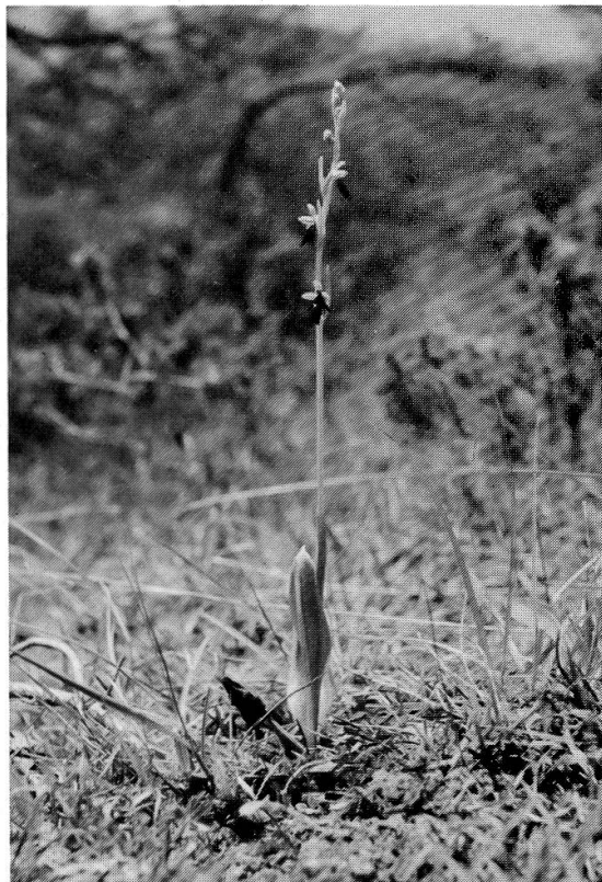
Abb. 3: Ophrys insectifera , die Fliegen-Ragwurz, wächst vor allem in lückenhaften Mesobrometen, im Halbschatten von Föhre oder Wachholder.

Als Beispiel sei das Vorkommen von Ophrys insectifera (Fliegen-Ragwurz) in der weiteren Umgebung der Dittinger Magerweiden erwähnt. Allgemein bevorzugt diese Art leicht beschatteten, wenig bewachsenen und skelettreichen Boden, wie er vor allem in lockeren Föhrenbeständen und Haselgebüschchen oder an Gebüschsäumen im Kontakt mit Magerrasen anzutreffen ist. Den geschlossenen oder intensiv beweideten Weiderasen meidet sie. Ihre ursprünglichen Standorte in der Umgebung von Dittingen dürften lichte Föhrenbestände an rutschigen, skelettreichen Steilhängen gewesen sein. Dort setzte im Mittelalter als erste anthropogene Umgestaltung die Waldweide ein, die wahrscheinlich die Standortbedingungen der Ophrys -Arten durch ständiges Offenhalten von Lichtungen verbessert hat. Die Verbote der Waldweide in der Neuzeit und damit die strenge Trennung und intensivere Nutzung von Wald- und Weidegebiet haben das ursprünglich wohl mehr zusammenhängende und flächenhafte Areal von Ophrys insectifera in der Umgebung von Dittingen auf lineare und disjunkte Standorte am Waldrand eingeschränkt. Ihre heutigen Fundorte im primären Areal hat sie stets vereinzelt am Rand der Magerweide gegen lockere Haselgebüsche, unter stehengelassenen Föhren und in einer als Quellgebiet von der übrigen Weide abgezünten Parzelle mit lockerem Baumbestand und mergeligen Erdanrissen.