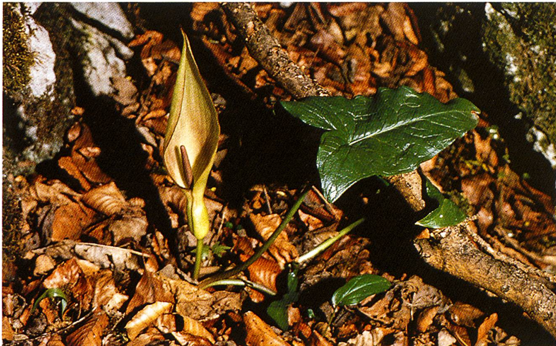
Abb. 6: Arum maculatum (Aronstab), Blütenstand (April-Mai). Auch die Blüten sind giftig.