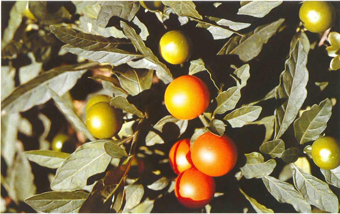
Abb. 13: Solanum pseudocapsicum (Korallenbäumchen). Die attraktiven giftigen Früchte dieser Zimmerpflanze (September/Okttober) üben auf Kinder einen besonderen Reiz aus.