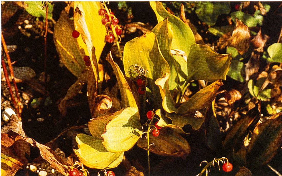
Abb. 8: Convallaria majalis (Maiglöckchen, Maierisli). Die ganze Pflanze (Blüten: Mai/Juni; Früchte: Juli/August) ist giftig.