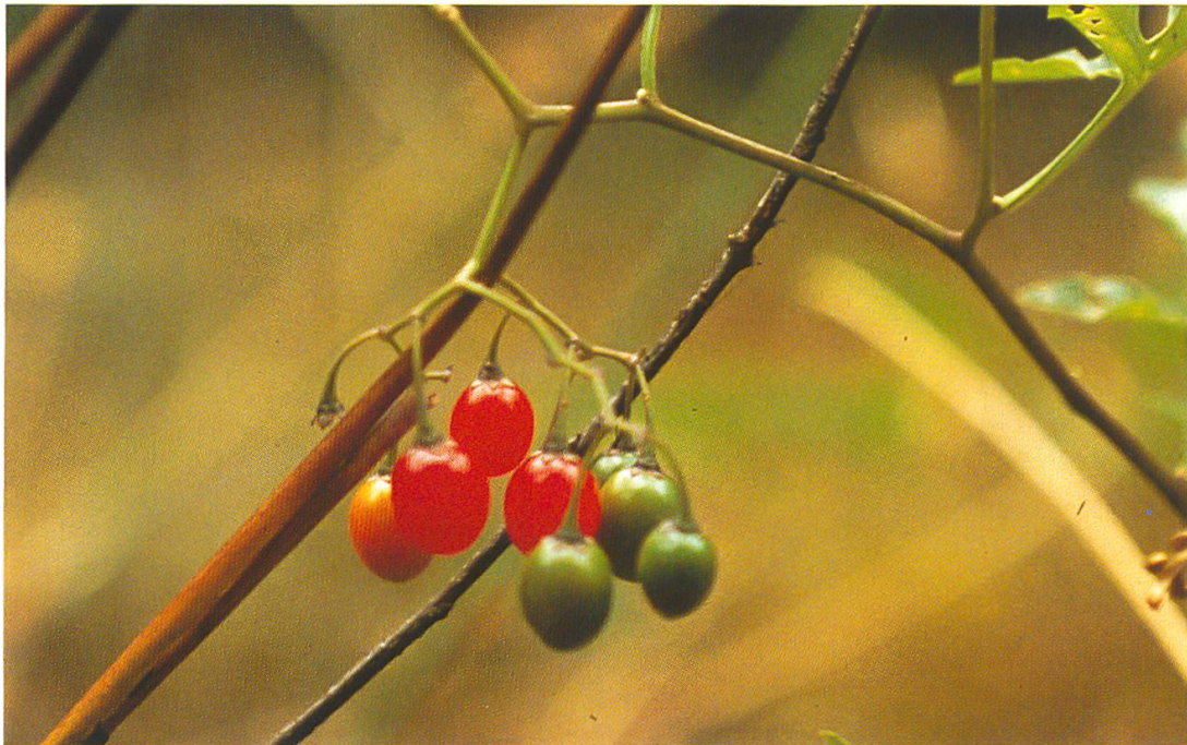
Abb. 10: Solanum dulcamara (Bittersüßer Nachtschatten). Die grüne Pflanze und die Beeren (August-Oktober) sind giftig.