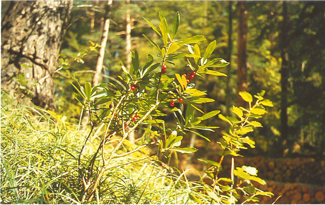
Abb. 1: Daphne mezereum (Seidelbast). Scharlachrote oder seltener gelbe Beeren mit glänzend grünem und später braunem Kern (August/September). Stark giftig.