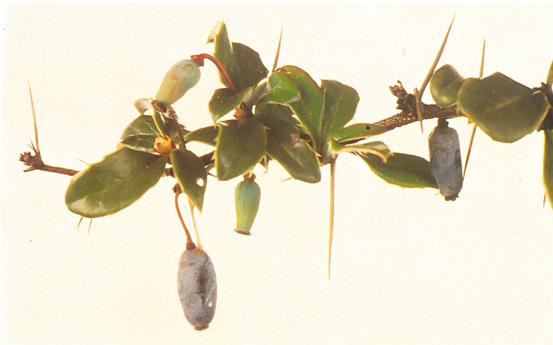
Abb. 14: Berberis vulgaris (Berberitze). Stamm- und Wurzelrinde der Berberitze weisen den höchsten Gehalt an Giftstoffen auf, während die Beeren (September–Dezember) als harmlos gelten.