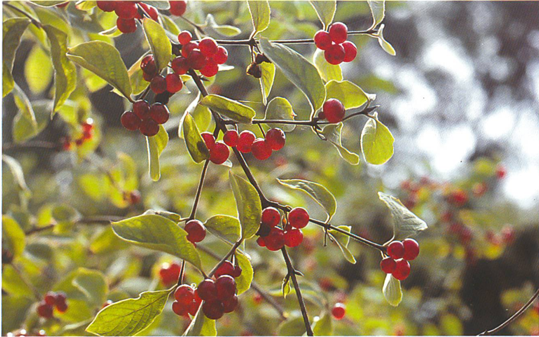
Abb. 15: Lonicera xylosteum (Heckenkirsche). Die schwach giftigen Beeren (August–Oktober) variieren stark in Gestalt und Farbe.