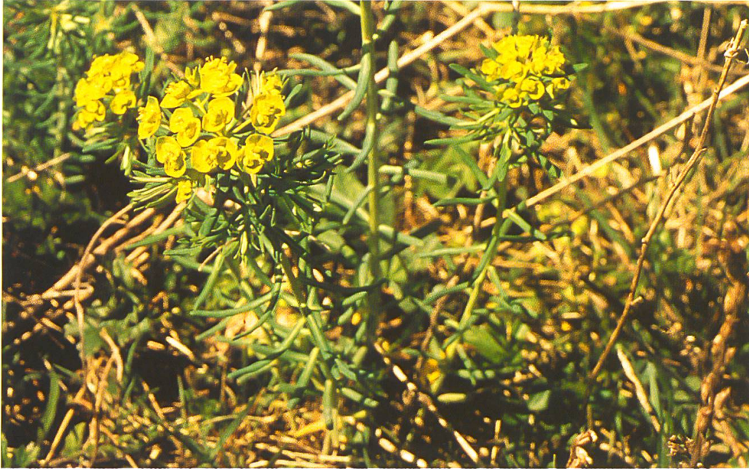
Abb. 9: Euphorbia cyparissias (Zypressen-Wolfsmilch). Der Milchsaft der Wolfsmilchgewächse führt zu entzündlichen Reaktionen der Haut und der Schleimhäute.