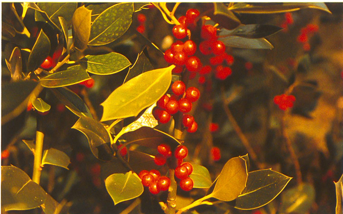
Abb. 4: Ilex aquifolium (Stechpalme). Die roten, seltener gelben, mehrsamigen Steinfrüchte sind ausdauernd (September–März). Giftig sind insbesondere die Früchte.