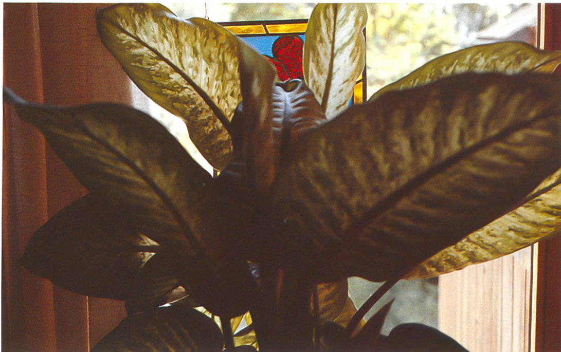
Abb. 12: Dieffenbachia maculata (Herzpflanze, Schweigrohr). Alle Organe dieser häufig gepflegten Zimmerpflanze sind giftig.