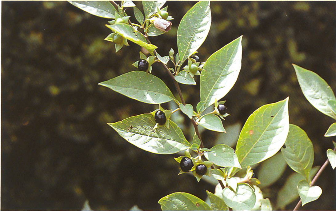
Abb. 3: Atropa belladonna (Tollkirsche). Insbesondere die glänzend schwarzen, im grünen Kelch sitzenden Beeren (Juli–Oktober) sind stark giftig.