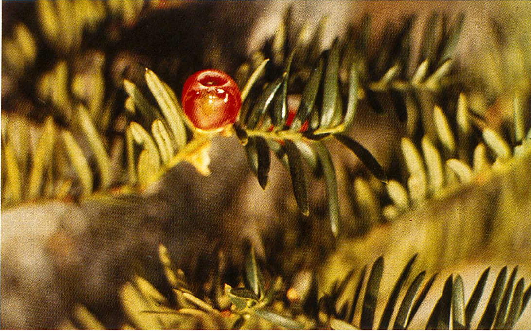
Abb. 5: Taxus baccata (Eibe). Mit Ausnahme des roten Samensmantels (August) sind alle Pflanzenorgane giftig.