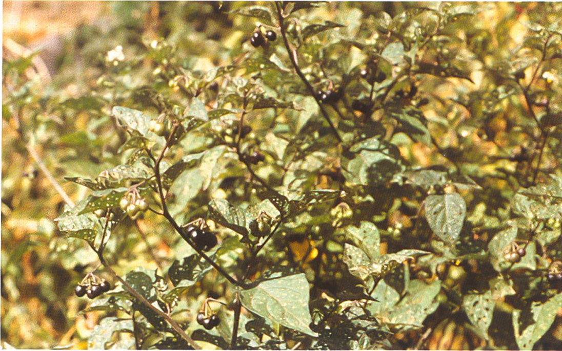
Abb. 11: Solanum nigrum (Schwarzer Nachtschatten). Wie bittersüßer Nachtschatten, Beeren jedoch schwarz und seltener grünlich-gelb.