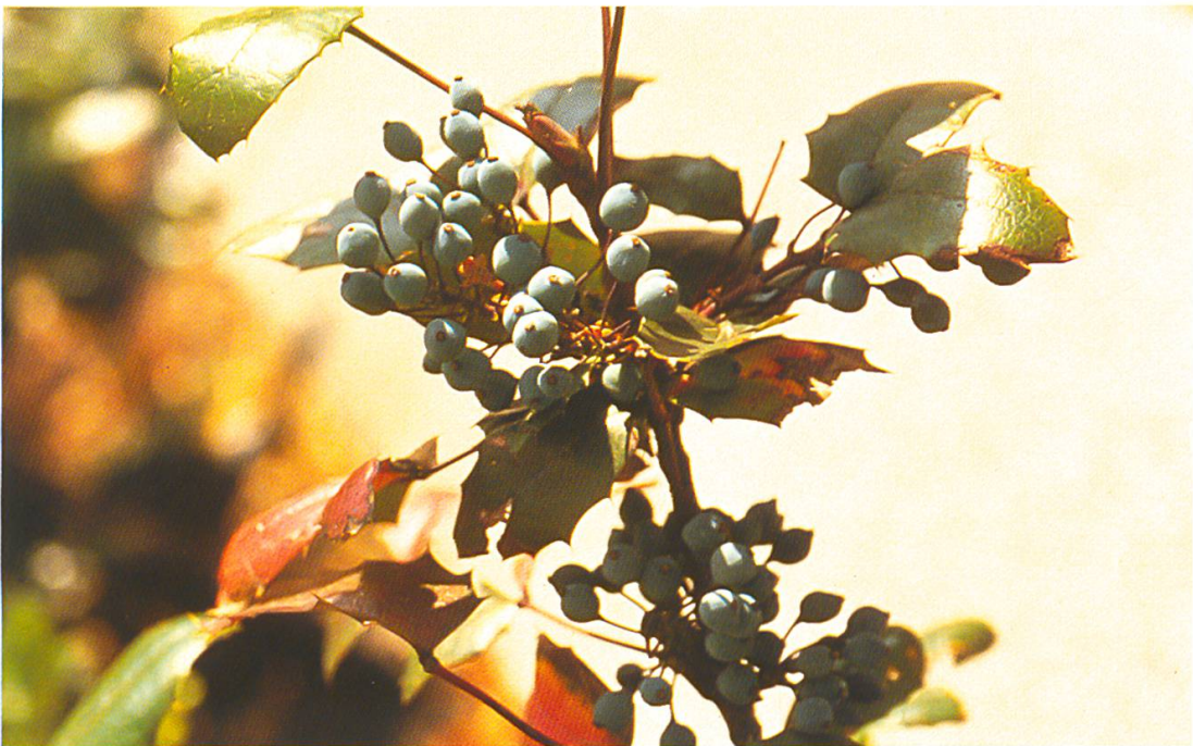
Abb. 16: Mahonia aquifolium (Mahonie). Die blaubereiften Beeren (August–Dezember) sind, in geringen Mengen aufgenommen, ähnlich harmlos wie diejenigen der Berberitze.