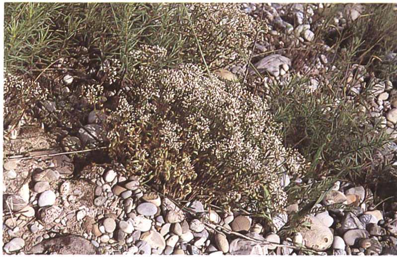
Weisser Mauerpfeffer ( Sedum album )