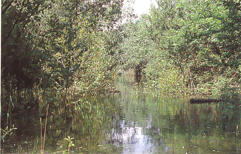
Überschwemmter Grubenboden Mai 1986 östliche Grube