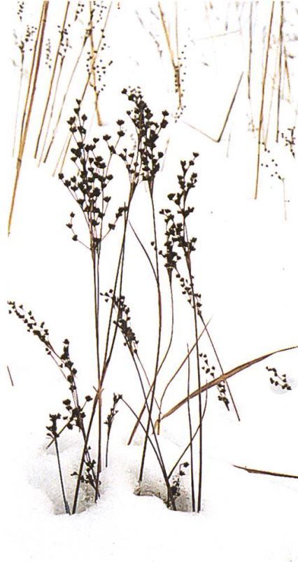
Winterstimmung (Binsen)