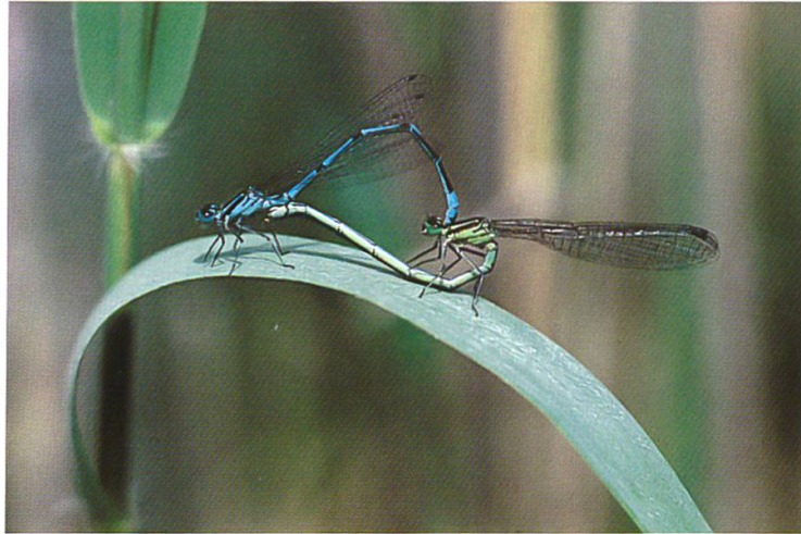
Paarungsrade der Hufeisenazurjungfer