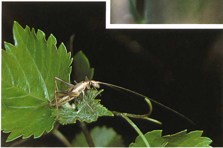
Weinhähnchen ( Oecanthus pellucens )