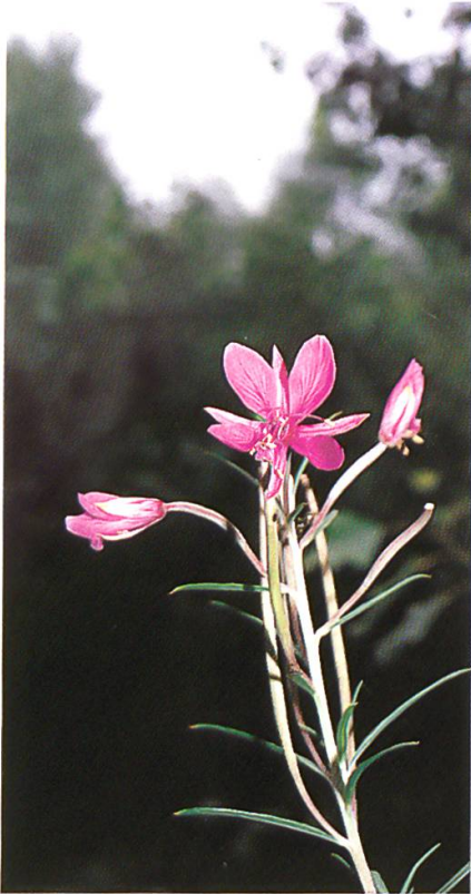
Blühendes Epilobium dodonaei