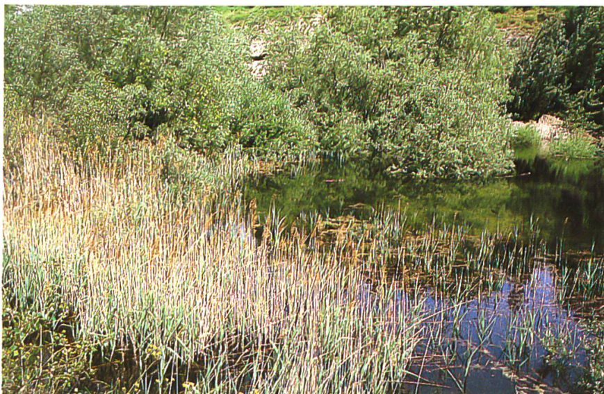
Schilfgürtel östliche grössere Grube