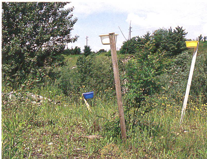
Farbschalen als Insektenfallen