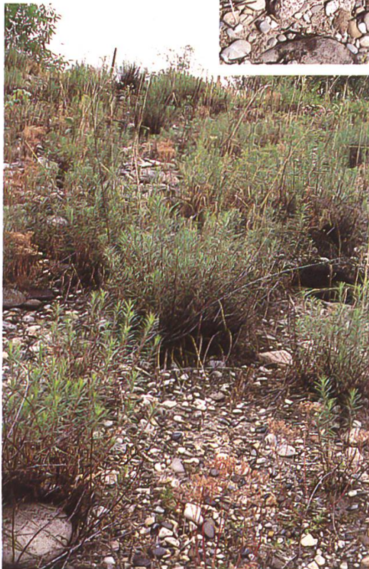
Typischer Standort von Epilobium dodonaei , einer Charakterpflanze des Zurlindenareals