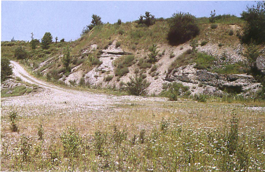
Zurlinden- gruben westliche kleinere Grube