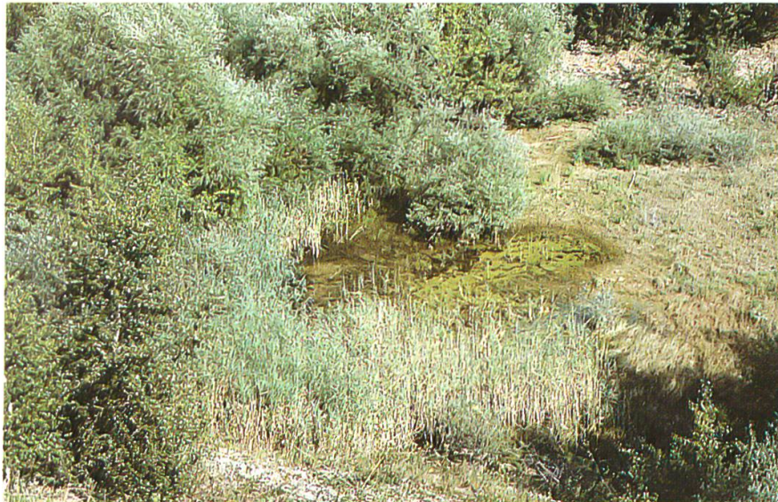
Schilfgürtel östliche grössere Grube