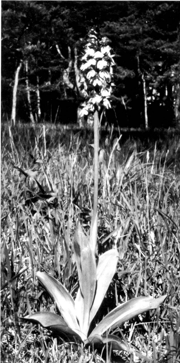
Abb. 6: Purpurorchis ( Orchis purpurea ) in voller Blüte: Einziges Exemplar dieser Art im Gebiet und damit als «lebendes Denkmal» eine besondere Fototouristen-Attraktion.

gesehen hat, ist mir nicht bekannt, möglicherweise ist dies aber K. WÜTHRICH selber. Weder HEINIS noch VOGT geben nämlich diese Art in ihren Listen an. Die Jahre 1985 und 1987 hat die Pflanze dann «unter Tag» zugebracht, während sie sich in den Jahren 1986, 1988, 1989, 1990 und 1991 jeweils zu voller Pracht entfaltet hat. Inzwischen ist sie für einen Teil der Orchideenfans zur Hauptattraktion des Reservats geworden und präsentiert sich zur Blütezeit wie ein Denkmal: Winzige Grasinsel mit hochaufragender prachtvoller Orchidee, auf drei Seiten (Osten, Süden und Westen) von unter Fotografenlast plattgewalzter Kraut- und Grasschicht umgeben. Gewisse Orchi-