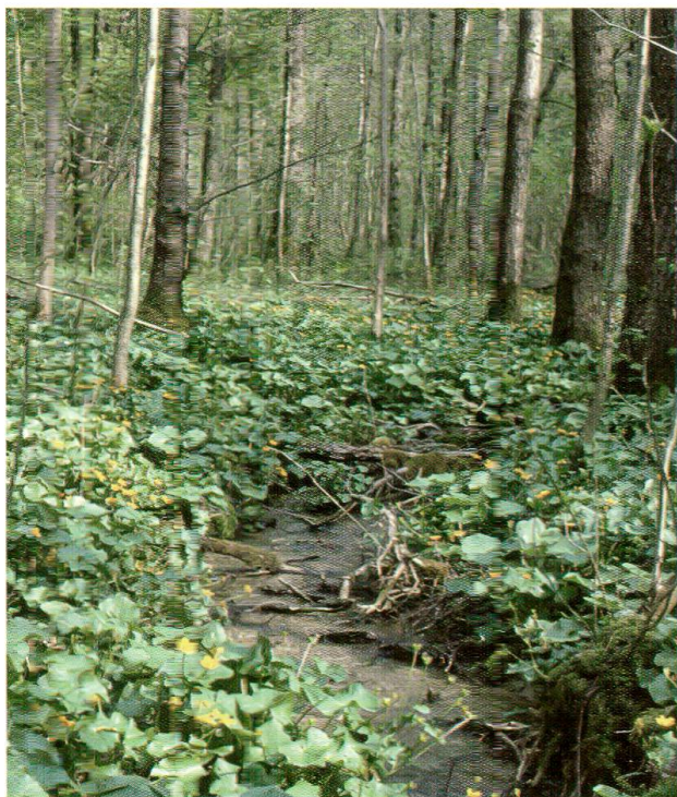
Abb. 4: Seggen-Bacheschenwald mit Riesen-Schachtelhalm ( Carici remotae-Fraxinetum equisetosum ). Frühlingsaspekt mit blühenden Sumpf-Dotterblumen ( Caltha palustris ).