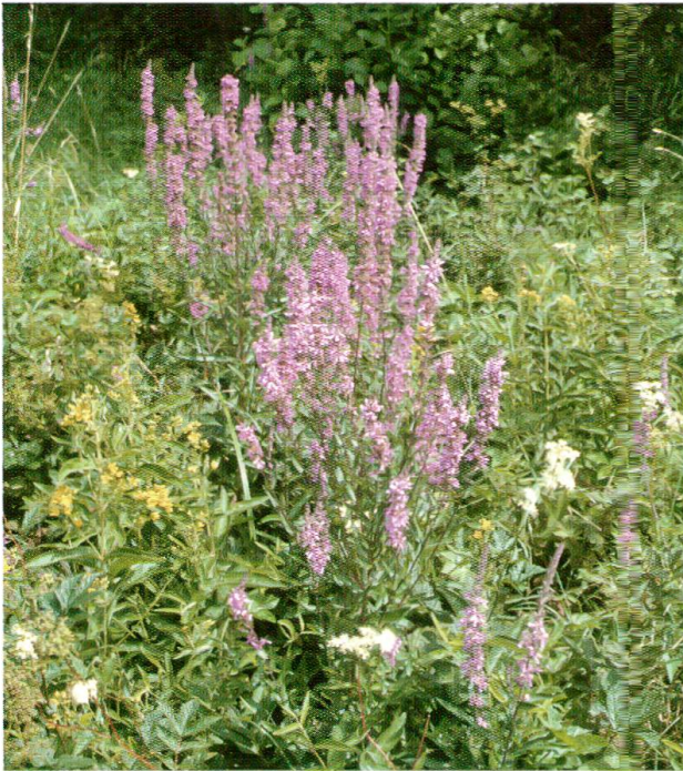
Abb. 6: Am Ufer des Wildensteiner Baches: Staudenflur mit Gemeinem Gilbweiderich ( Lysimachia vulgaris ), Blut-Weiderich ( Lythrum salicaria ) und Moor-Spierstaude ( Filipendula ulmaria ).