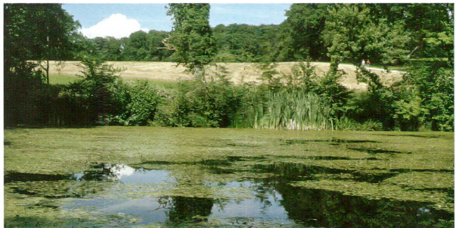
Abb. 7: Weiher im Sommer. Das Schwimmende Laichkraut ( Potamogeton natans ) bildet einen dichten Teppich.