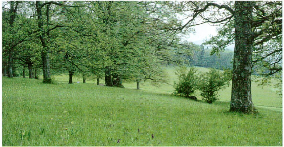
Abb. 5: Eichenhain mit Kleinorchis-Trespenwiese ( Orchideto morionis-Mesobrometum ) im Frühling. Kleines Knabenkraut ( Orchis morio ) und Frühlings-Schlüsselblume ( Primula veris ) blühen.