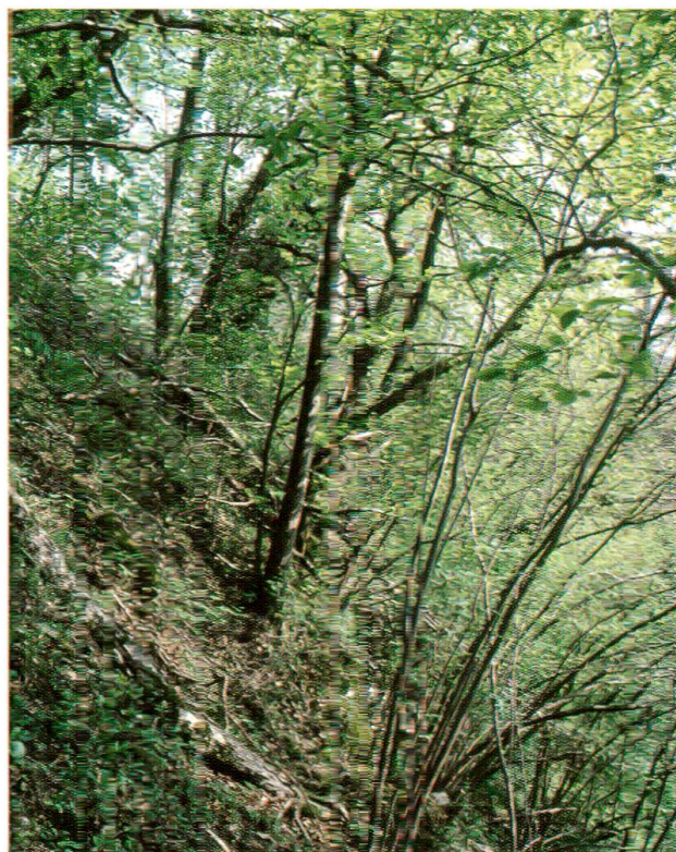
Abb. 3: Linden-Zahnwurz-Buchenwald ( Cardamino-Fagetum tilietosum ) unterhalb des Schlosses.