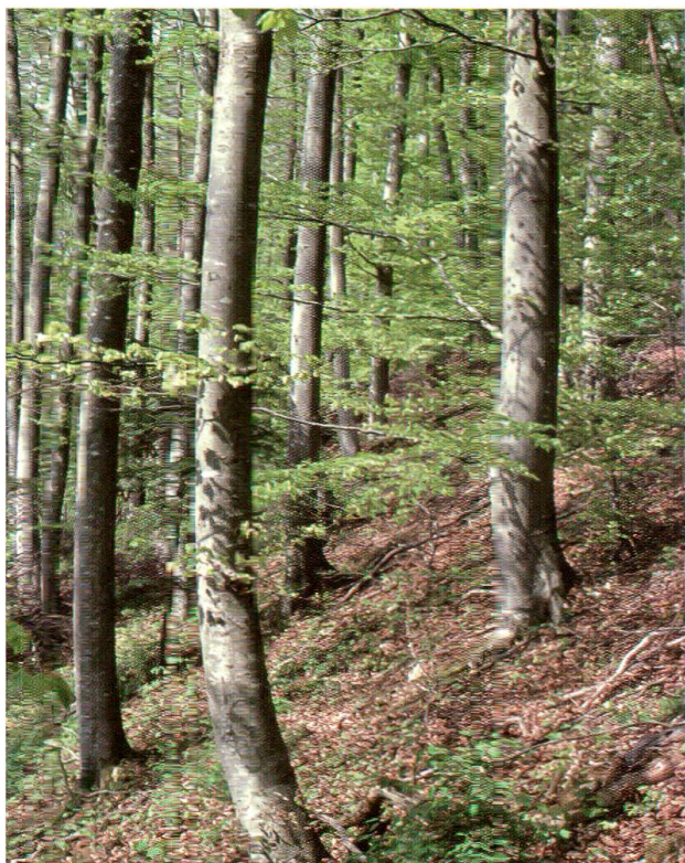
Abb. 2: Lungenkraut-Buchenwald ( Pulmonario-Fagetum typicum ), südwestlich des Schlosses.