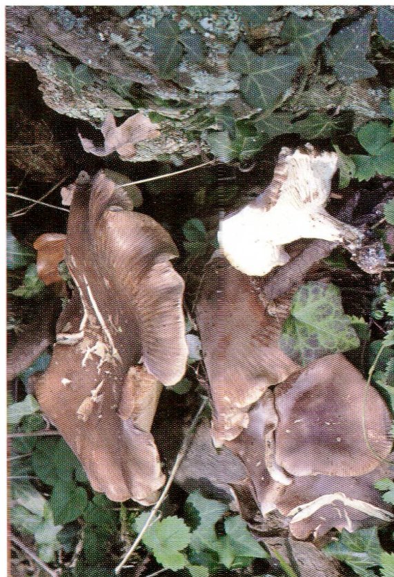
Abb. 5: Leucopaxillus gentianeus , Bitterer Krenpenritterling.