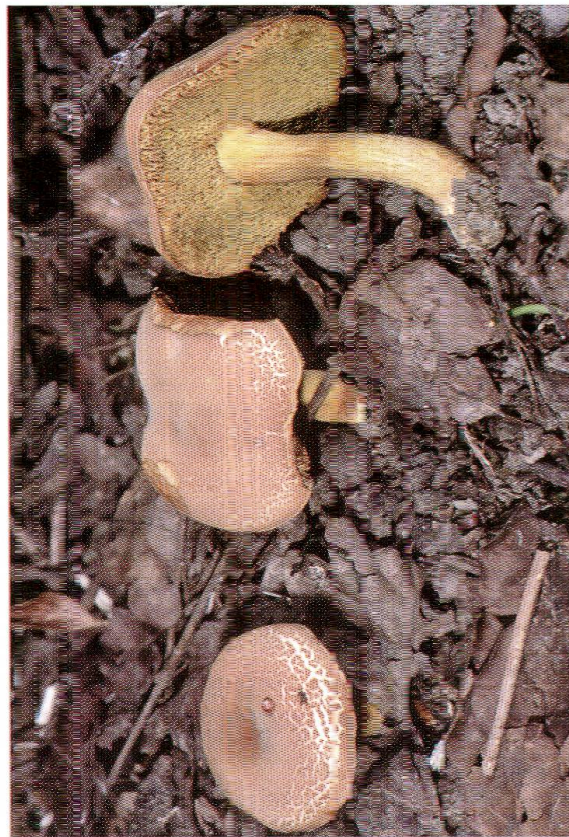
Abb. 8: Xerocomus communis , Eichen-Filzröhrling.