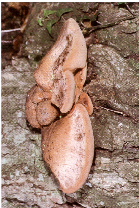
Abb. 4: Fistulina hepatica , Eichen-Leberreisichling.