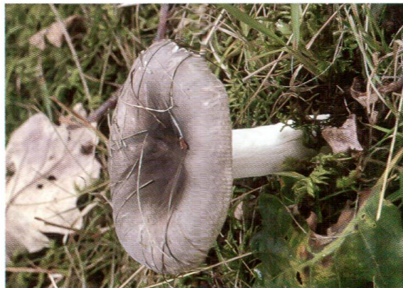
Abb. 2: Russula anatina , Graugrüner Reiftäubling.