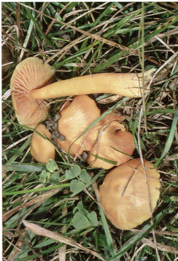
Abb. 7: Hygrocybe quieta , Schnürsporiger Saftling.