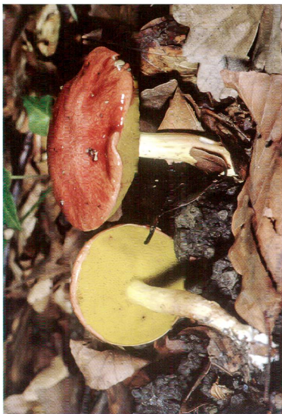
Abb. 1: Pulveroboletus gentilis , Goldporiger Röhrling.