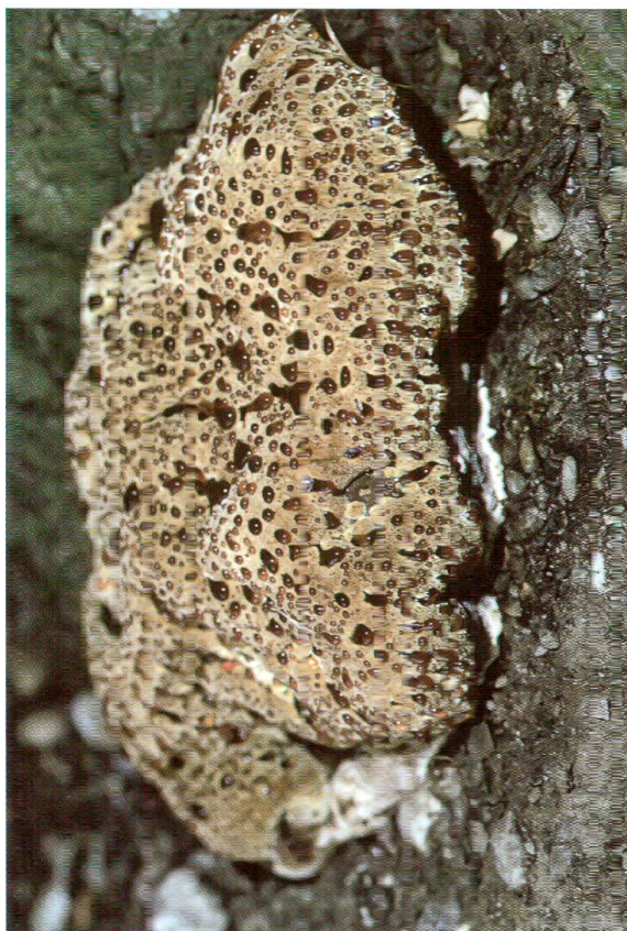
Abb. 3: Inonotus dryadeu , Tropfender Schillerporling.