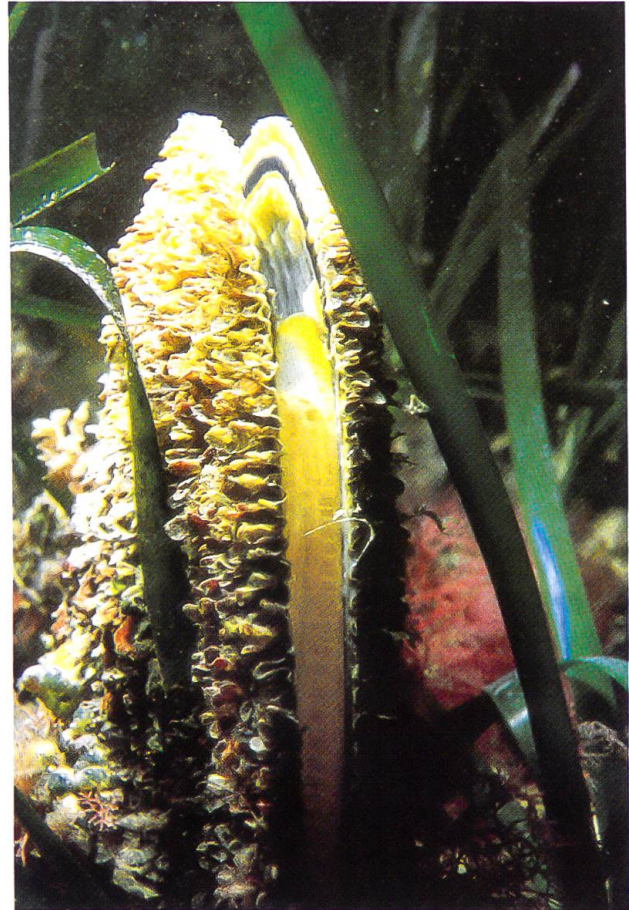
Abb. 1: Pinna nobilis in ihrem Lebensraum, rund 20 cm aus dem Untergrund herausragend.

Seit den 1980er Jahren werden in Korsika, Südfrankreich, Spanien, Sardinien und Kroatien die Pinna nobilis und ihre Lebensumstände er-