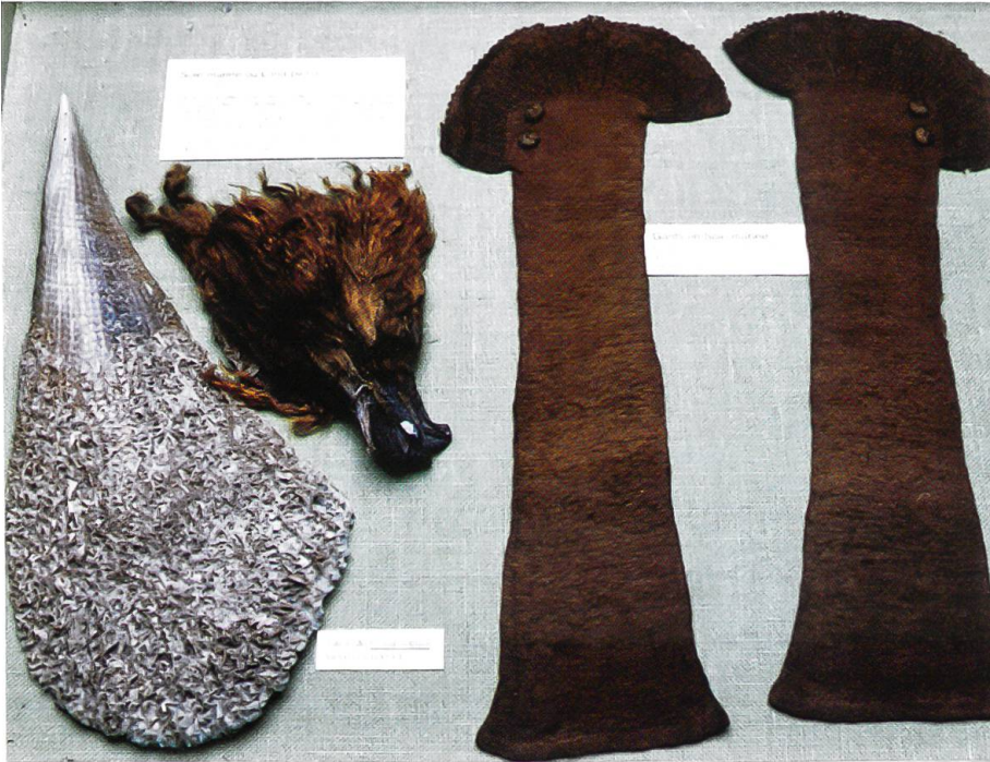
Abb. 4: Vitrine im Musée zoologique der Universität Louis Pasteur, Strasbourg, Frankreich, mit Muschel, Faserbart und Ellbogenstulpen aus Muschelseide (Photo Musée zoologique, Strasbourg).

Universitätsprofessor Jean Hermann (1738–1800). Dessen Sammlung wurde später in das 1893 gegründete Museum integriert.