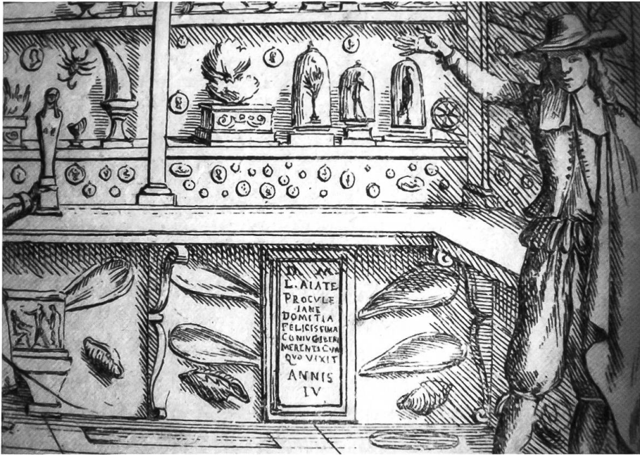
Abb. 3: Ausschnitt aus Museo Cospiano (aus Legati 1677).

ser. Jedenfalls ist noch nicht von Textilien die Rede, im Gegensatz zum folgenden Beispiel.