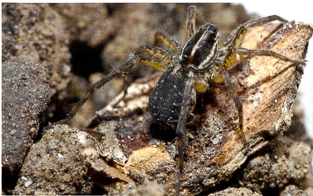
Abb. 5: Pardosa mixta (Wolfspinnen)

methoden und die ungleiche Intensität der Aufsammlungen in verschiedenen Teilbereichen erlauben es nicht, umfangreiche statistische Auswertungen zu machen. Einige grundsätzliche Aussagen lassen die Daten aber dennoch zu.