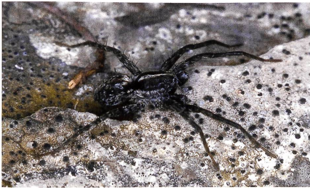
Abb. 4: Pardosa oreophila (Wolfspinnen), Männchen.