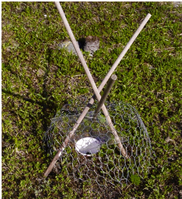
Abb. 2: Bodenfalle mit weissem Fangbecher und Schutzgitter gegen Wirbeltiere und mit eingepasstem, transparentem Dach gegen Regen. Fixiert gegen Wind und Schafe mit drei Holzstäben.