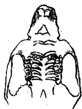
Zwei vom Typus abweichende Formen von Mus poschiavinus.