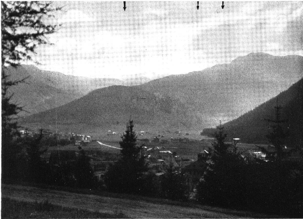
Fig. 2. Eckentreppe des Bühlenberggrates zwischen Flüela- und Dischmatal. Deutlich sichtbar die 1850er, 2100er und 2400er Eckenflur. (Zu Seite 295.)