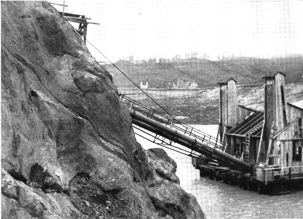
Fig. 1. Schluchtwand mit Erosionskesseln, sichtbar bei maximaler Absenkung des Sees im Herbst 1923. Der obere Rand der Wand liegt normalerweise 10 m unter Seespiegel. (Zu Seite 289.)