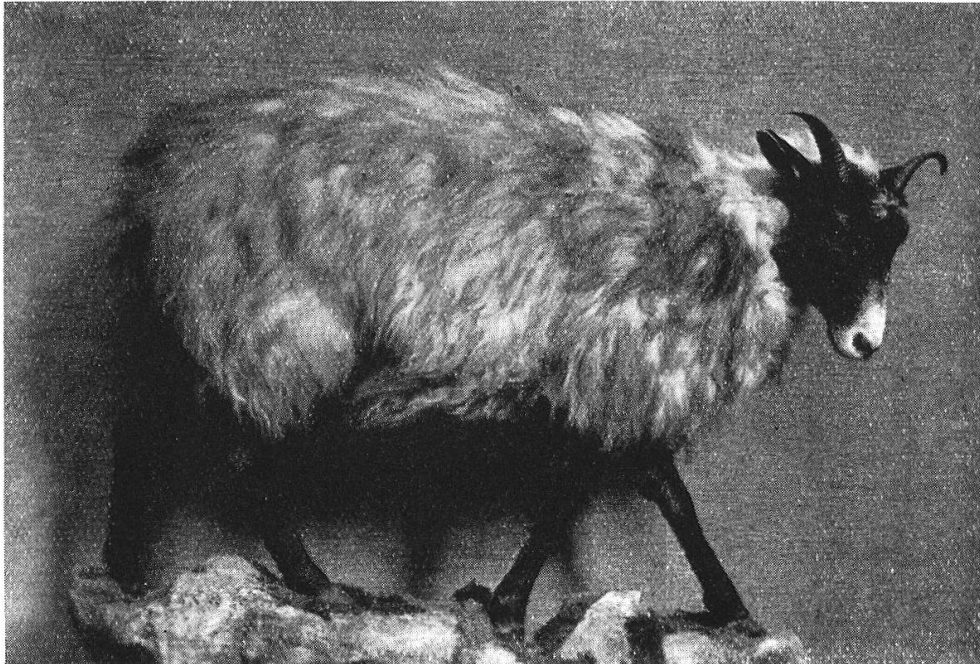
Weibliches Bündneroberländerschaf von Vrin im Lugnez. 1902

(Totalpräparat im Bündner Naturhistorischen und Nationalparkmuseum in Chur)