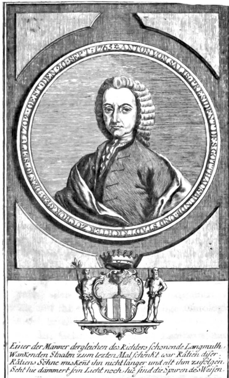
Anton von Salis (1702—1765)