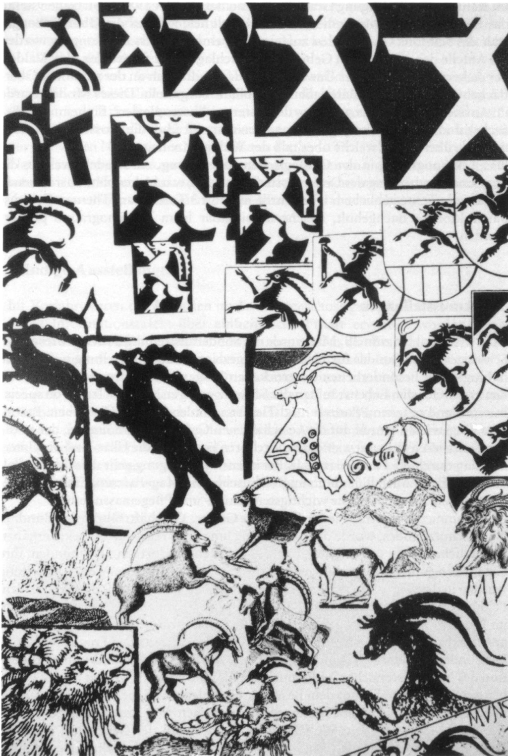
Steinbockdarstellungen im Wandel der Zeit.