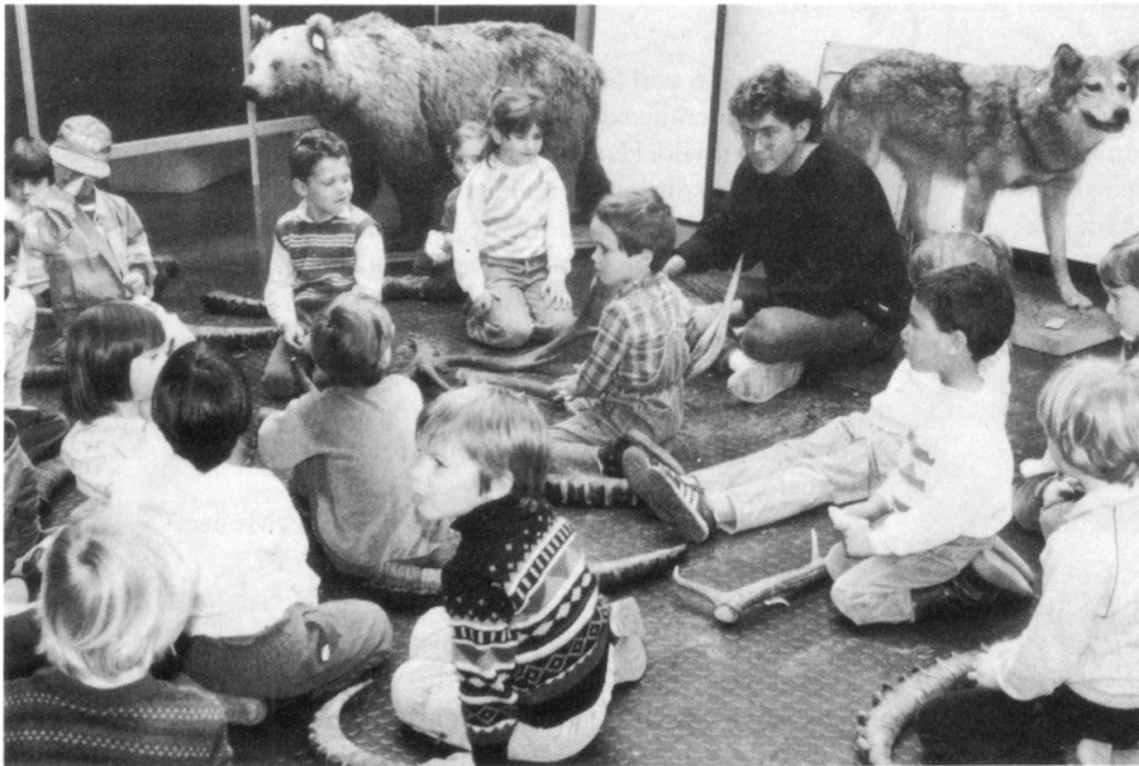
Bei speziellen Führungen und Kursen kann der Leiter auf die Bedürfnisse der Teilnehmer gezielt eingehen und auch Material aus den Sammlungen miteinbeziehen.

Die Naturforschende Gesellschaft Graubünden führte im Saal des Museums 8 Vortragsabende durch.