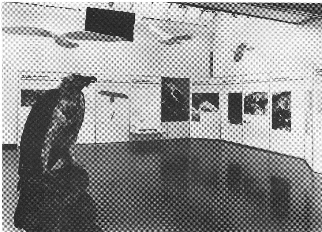
Die Sonderausstellung «Der Bartgeier» war Teil einer Informationskampagne, die der Wiederansiedlung des Bartgeiers in Graubünden vorausging.

Wesentlich kleiner als die beiden genannten Eigenproduktionen war die Ausstellung «Von der Maus bis zum Kaninchen» , welche im Dezember 1988 zusammen mit dem Graubündner Tierschutzverein realisiert wurde. Sie orientierte über die