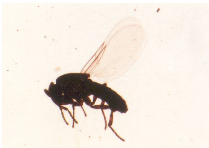
Abb. 1: Rhexoza flixella sp. nov., Männchen.

Unter den rund 2000 verschiedenen Arten von Pflanzen und Tieren, die am 3. Juni 2000 von den zahlreichen WissenschaftlerInnen der Schweizer Museen im Rahmen des 2. GEO-Tages der Artenvielfalt im Gebiet der Alp Flix festgestellt wurden, befand sich eine sehr kleine Mücke aus der Familie der Scatopsidae, die bald zum Star des Tages gekrönt wurde. Tatsächlich wurde mit diesem Zweiflügler eine für die Wissenschaft neue, noch nicht beschriebene Art entdeckt. Sie wird im Folgenden neu beschrieben. Diese winzige Mücke ist der lebendige Beweis dafür, dass unsere Kenntnis der Biodiversität – auch in unserem kleinen und relativ gut erforschten Land – noch sehr lückenhaft ist.