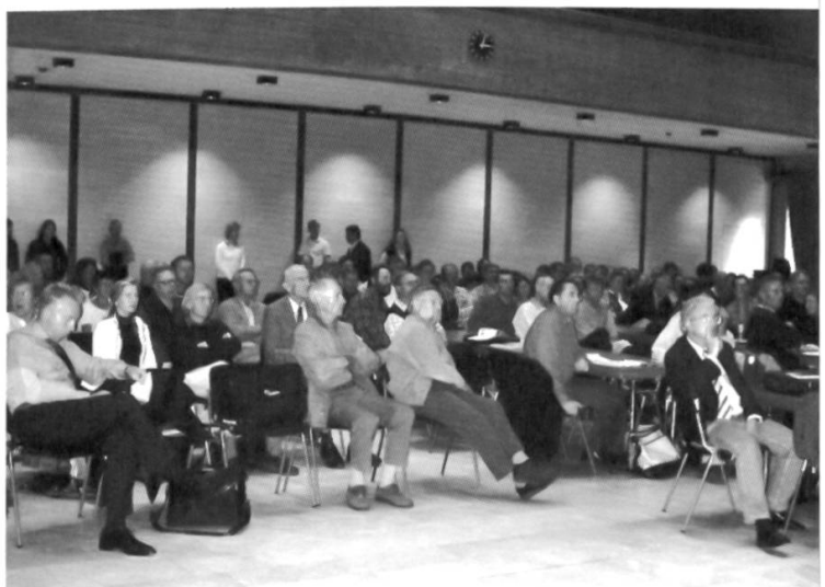
Ein voller Plenarsaal verfolgt mit gespannten Gesichtern den Themen und Ausführungen der Hauptsymposiums-Referenten.