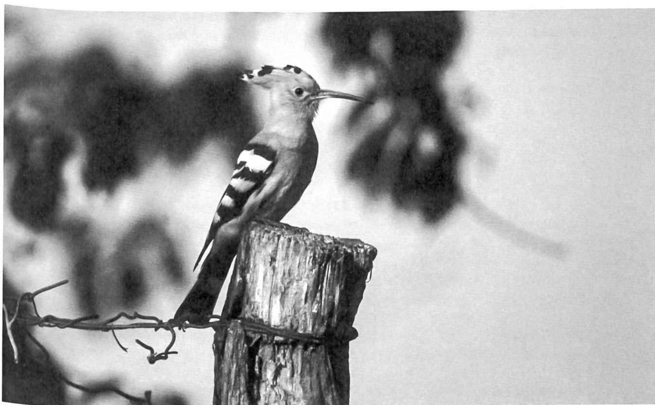
Die OAG untersucht die Verbreitung des Wiedehopfs im Kanton Graubünden.

U. Schmid untersuchte in Zusammenarbeit mit der Schweizerischen Vogelwarte Sempach die Rauchschwalbenpopulation bei Küblis, bei der junge Rauchschwalben und deren Eltern beringt werden.