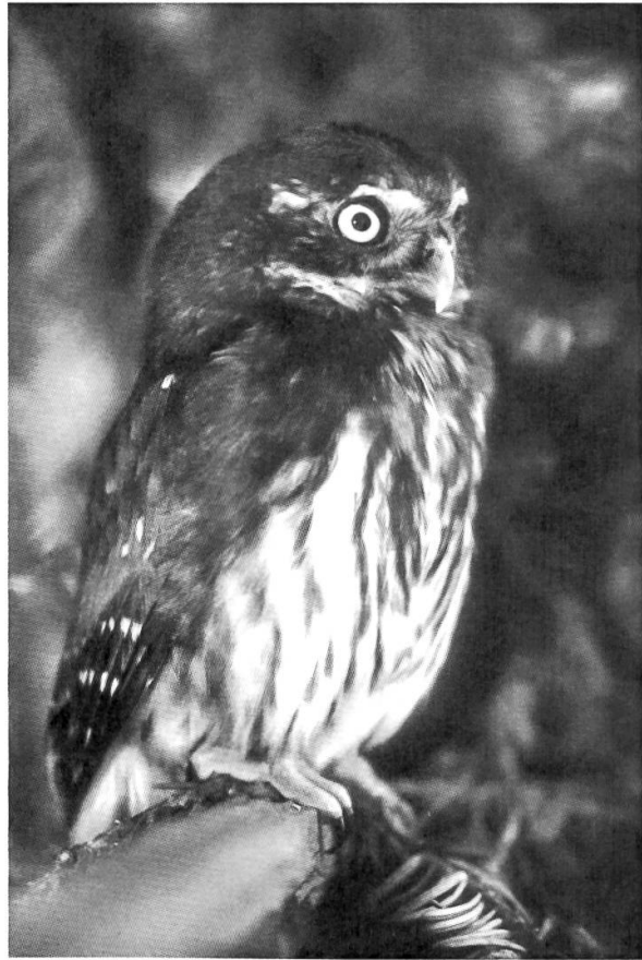
Sperlingskauz in der Pflegestation von Chr. Meier.