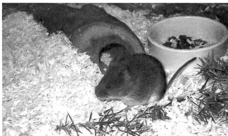
Die Schneemaus begeistert im Bündner Natur-Museum sowohl Besucher als auch Forscher.

Die Sammlungen sind im Besitz der Stiftung Sammlung Bündner Natur-Museum, welche für die Vermehrung und Erschliessung der Sammlungen die Verantwortung