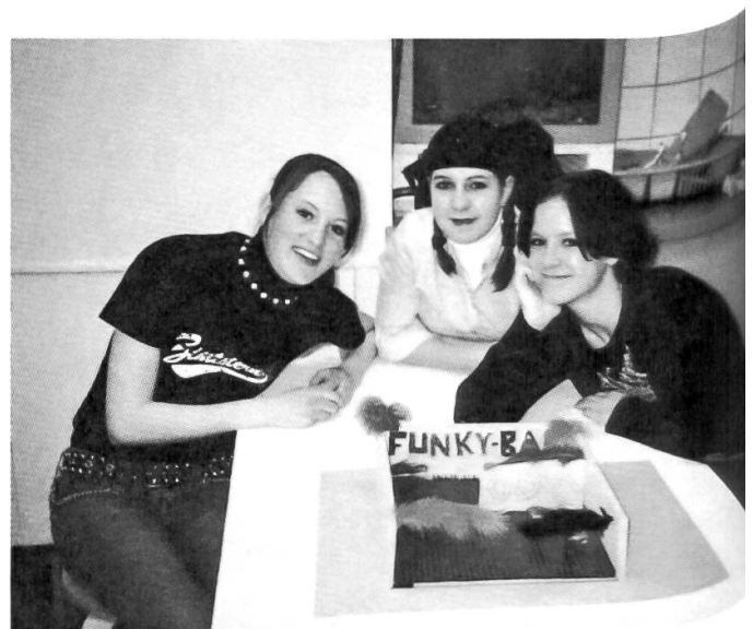
Viel Spass hatten die Jugendlichen an den Workshops zum Thema «Museumsfrust – Museums-lust».

Der Museumspädagoge wurde von zwei Praktikantinnen unterstützt. Bei jeder Sonderausstellung organisierte er einen Informationsabend für die Lehrkräfte, an dem die umfangreichen Unterlagen für die Schulen erläutert wurden. An den museumspädagogischen Aktivitäten nahmen 83 (Vorjahr 120) Gruppen und Schulen teil mit insgesamt 1905 (Vorjahr 2507) Personen. Der Museumspädagoge führte verschiedene Lehrerfortbildungskurse durch. Zusätzlich übernahm er die Leitung der Publikumsbetreuung im ganzen Haus und die Organisation der Werbung. Die unter dem Motto «Rendez-vous am Mittag» lancierte