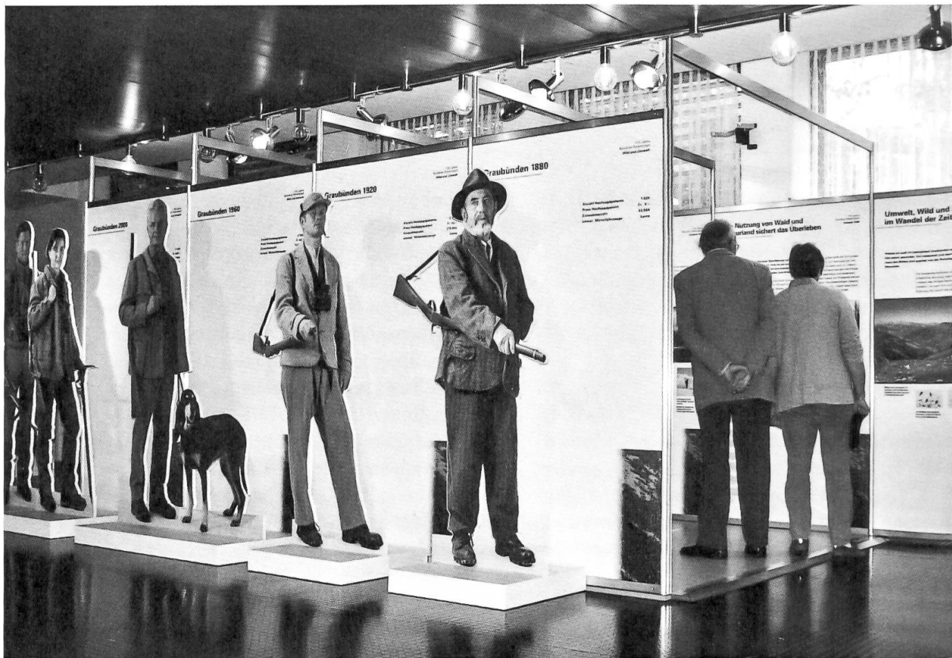
Die Sonderausstellung «Phänomen Jagd» behandelt ein Thema im Spannungsfeld Landschaft – Wild – Mensch, das in Graubünden immer aktuell ist.