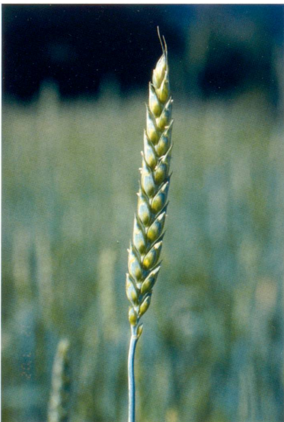
Abb. 8: Weizen, Varietät lutescens , unbegrannter Weizen, Herkunft Flond, Genbanknr. 4374.

KARL HAGER (1916) beschreibt ausführlich wie der Ackerbau vor 100 Jahren im Bündner Oberland ausgesehen hat. Das Getreide wurde früher gartenmässig angebaut (vgl. Tabelle 16 von Paravicini). Die Parzellen waren klein und im Sinne eines Risikoausgleichs über die Flur verteilt. Im Nordtirol ging man noch eine Stufe weiter. Dort gab es Gegenden (z.B. im Ötztal) wo das Getreide sogar Korn für Korn gesteckt wur-