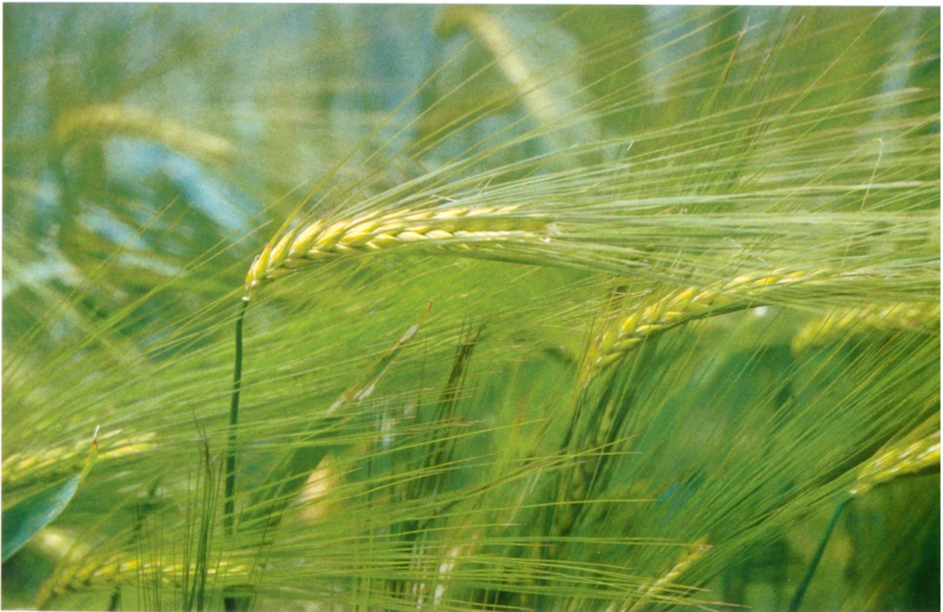
Abb. 7: Gerste, Varietät coeleste , nackte sechszeilige Gerste, Herkunft Wallis.

Verhältnissen bis einem Ertragspotential von 35–40 kg/Are können sie modernen Sorten überlegen sein, wobei sich das Gewicht zu Gunsten moderner Sorten wie Aletsch (Sommerweizen) oder Pollux und Ataro (Winterweizen) verschiebt, die speziell für den extensiven bzw. biologischen Anbau gezüchtet worden sind.