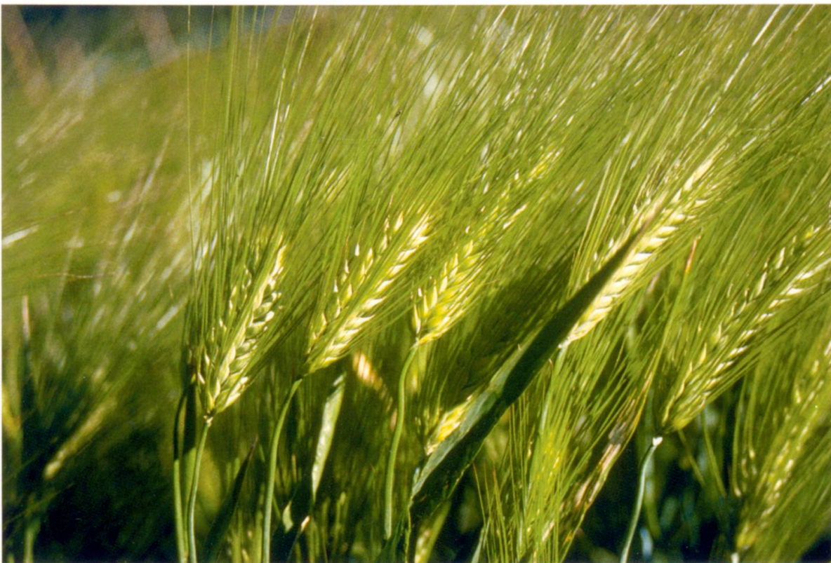
Abb. 1: Gerste, Varietät parallelum , mitteldichte sechszeilige Gerste, Herkunft Ramosch, Genbanknr. HV 642.

Die Genbankmuster sind aus Populationsorten ausgelesene Linien. Diese Populationsorten sahen sehr unterschiedlich aus. Es gab Felder die einen einheitlichen (mo-