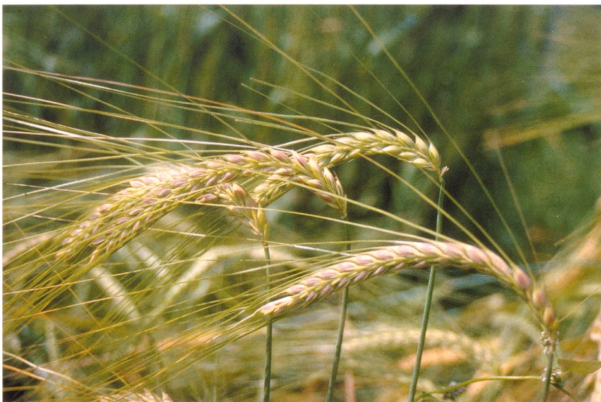
Abb. 3: Gerste, Varietät nutans, nickende zweizeilige Gerste, Herkunft Falera, Genbanknr. HV 041.