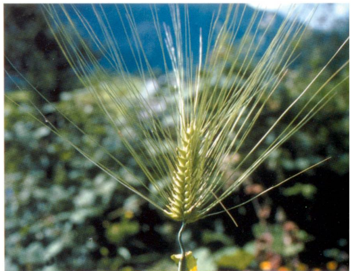
Abb. 5: Gerste, Varietät densum , dichtährige sechszeilige Gerste, Herkunft Saas im Prättigau, Genbanknr. HV 060.

konnte nicht bestimmt werden. Dazu wären spezielle Untersuchungen notwendig.