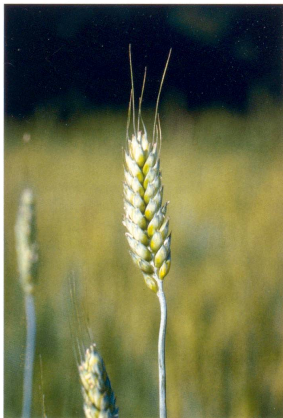
Abb. 9: Weizen, Varietät Wernerianum , Binkelweizen, Herkunft Obersachsen, Genbanknr. 4379.