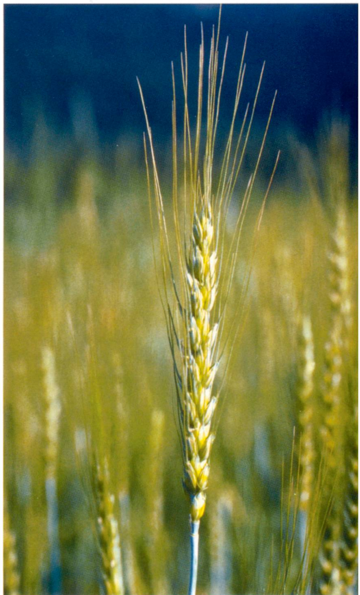
Abb: 6. Weizen, Varietät graecum , begrannter Weizen, Herkunft Andiaast, Genbanknr. 7364.

( Puccinia striiformis Westend.) Auffallend ist auch hier die grosse Bandbreite der Werte, welche von sehr anfällig bis nicht anfällig reicht. In einem Gelbrostjahr wie 2001 sind die anfälligen Herkünfte stark benachteiligt und diese würden früher in den Populationen anteilmässig abgenommen haben. In einem Braunrostjahr mit wenig Gelbrost konnten sie sich wiederum erholen, jetzt zu Lasten der Braunrost anfälligen Herkünfte. Ein paar Herkünfte sind auf Spelzenbräune