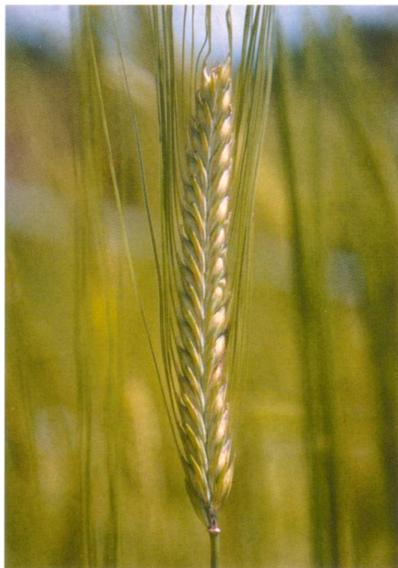
Abb. 2: Gerste, Varietät erectum , aufrechte zwei-zeilige Gerste, Herkunft Ramosch, Genbanknr. HV 638.

Bei den Winterweizenproben (vgl. Tabelle 4) handelt es sich um Linien aus der Auslesezeit, die 1907 mit der Veredlung des Plantahofweizens durch Linienauslese durch