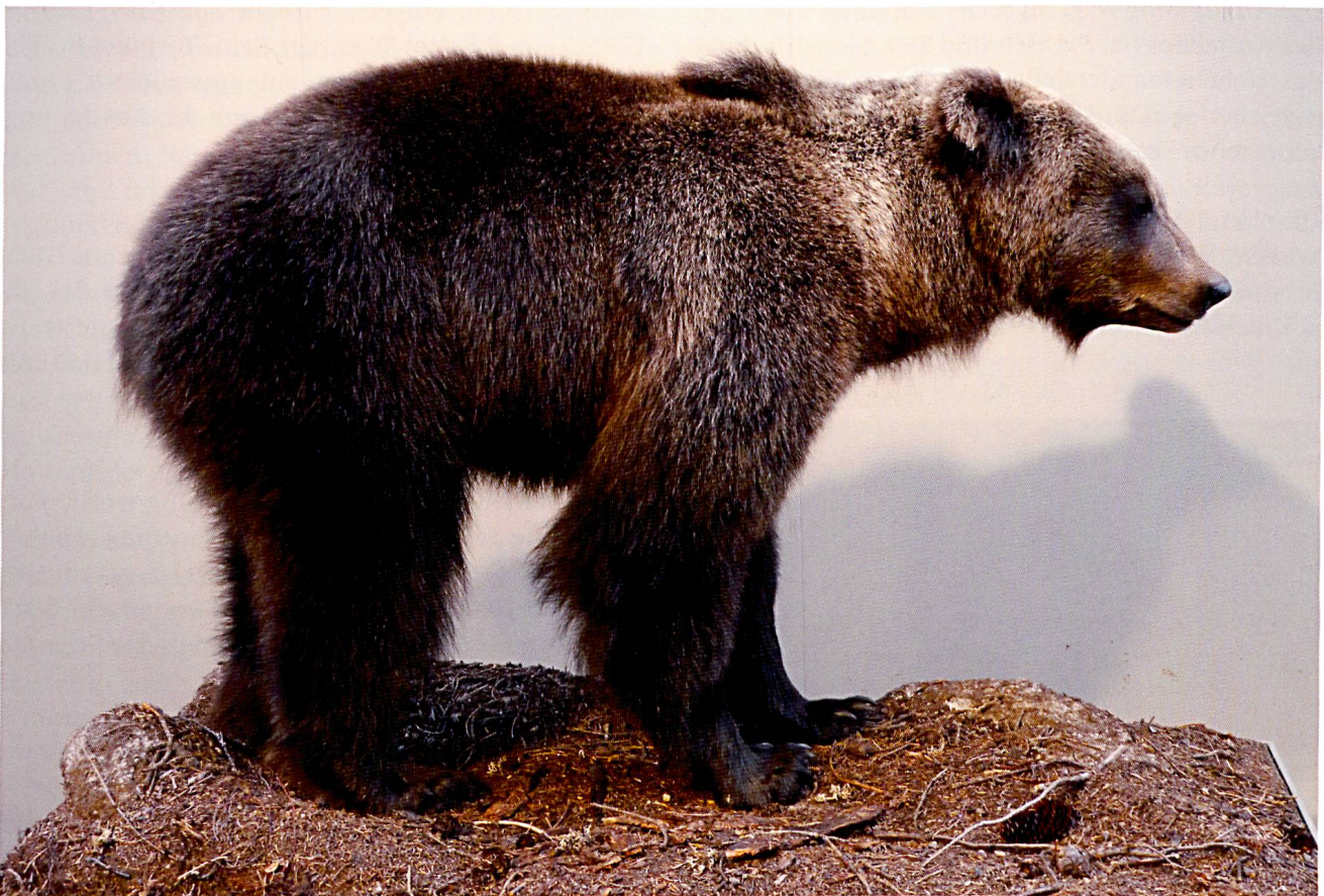
Der Bär JJ3 wurde im Frühjahr 2008 am Glaspass erlegt.

Sonderausstellungen sind eine einmalige Gelegenheit eine Auswahl der vielen Themen, welche in den ständigen Ausstellungen nicht gezeigt wer-