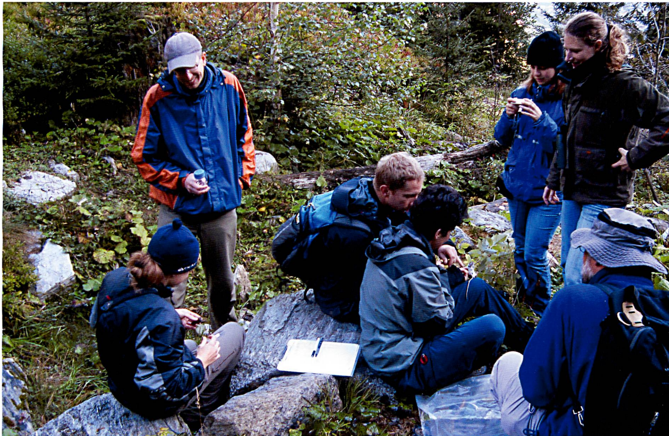
Die Säugercamps fanden in verschiedenen Regionen des Kantons statt.

Kantons, in der übrigen Schweiz und sogar im Ausland gezeigt. Die mit Unterstützung des BNM vom Zoologischen Museum der Universität Zürich realisierte Ausstellung über den Steinbock gastierte im Museo Civico di Storia Naturale di Roma.