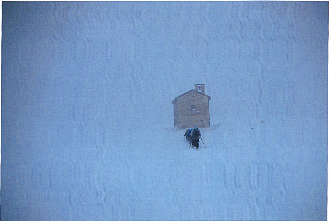
Ungewöhnliche Witterungsverhältnisse sind kein Grund, die Schneeschuhwanderungen auf der Alp Flix abzusagen..

Die durchgeführten Symposien richteten sich an Fachleute und an Laien mit entsprechenden Kenntnissen. Durchgeführt wurden die Symposien « Biologie und Management der Hasen » (2004), « Kleinraubtiere – Biologie und Management » (2005), « Schatzinsel Alp Flix, 7 Jahre danach » (2007), « Kleinsäuger im Alpenraum » (2007), « Fische im Einzugsgebiet des Alpenrheins »