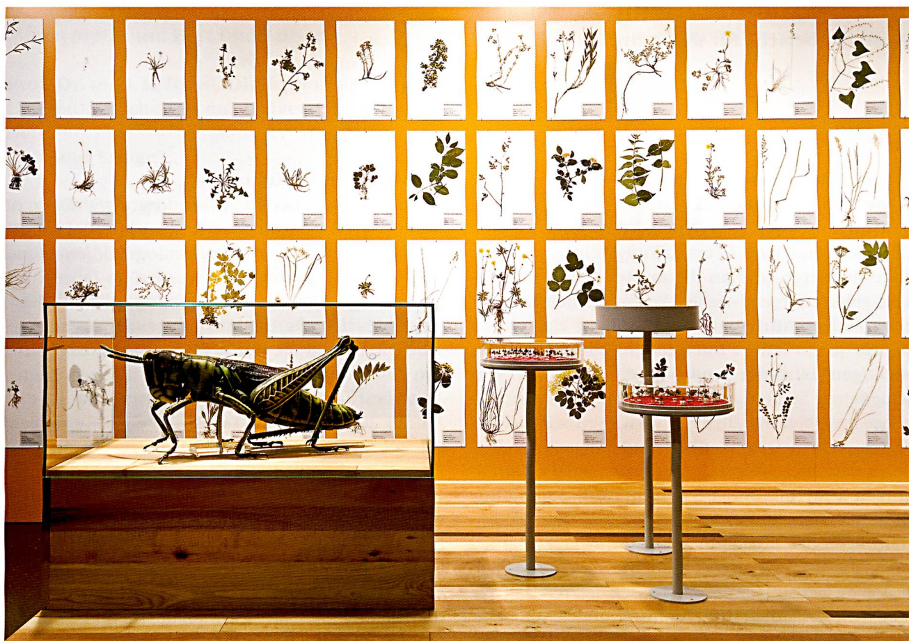
Ein Blick in die neue Dauerausstellung im 1. OG zum Thema Biodiversität. (Foto R. Feiner).

nierten Reihenfolge präsentiert. Die Besucherinnen und Besucher wählen ihren Rundgang selbst und entdecken so die Vielfalt auf individuelle Art und Weise. 4 spiralförmige Module in den 4 Ecken des Raumes vermitteln etwas Theorie. Dargestellt werden die Themen «Die Entstehung der Vielfalt im Laufe der Evolution», «Was ist eine Art?», «Die Bedeutung der Vielfalt in den Ökosystemen» und «Die Bedeutung der Vielfalt für den Menschen». Im Forscherlabor erhalten Jung und Alt Gelegenheit, interessante Objekte selbst in die Hand zu nehmen und zu studieren. Ein interaktives System erlaubt zudem einen Einblick in die wissenschaftlichen Sammlungen des Museums.