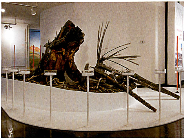
Das Modul «Neues Leben dank Lawinen» in der Sonderausstellung «Weisse Wunderware Schnee». (Foto BNM).

Weisse Wunderware Schnee. Eine gemeinsame Produktion des Bündner Naturmuseums, des Rätischen Museums und des Bündner Kunstmuseums