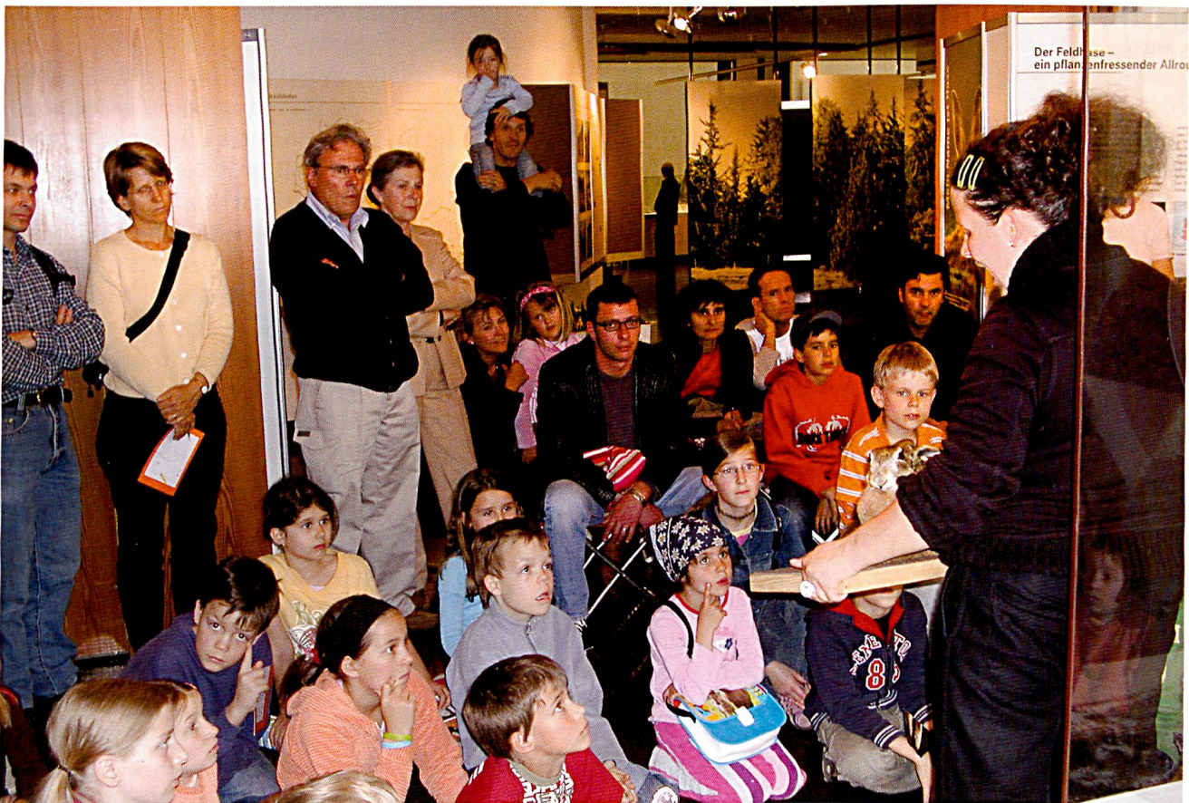
Das Museumspädagogische Angebot des Museums stösst in jeder Hinsicht auf ein grosses Interesse.

Neben den Kindern und Jugendlichen richteten sich museumspädagogische Veranstaltungen auch an Erwachsene: So wurden zum Beispiel Tiermärchen nur für Erwachsene angeboten, im Rahmen des Lernfestivals naturkundliche Kurse organisiert oder Abendführungen durch die Ausstellungen durchgeführt. Sowohl der Museumsdirektor als auch der Museumspädagoge hielten in verschiedenen Regionen Graubündens Vorträge zu ganz unterschiedlichen naturkundlichen Themen und erreichten so viele Naturinteressierte ausserhalb des Museums.