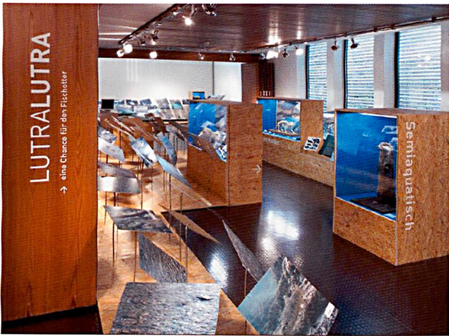
Sonderausstellung «Lutra lutra – eine Chance für den Fischotter»..