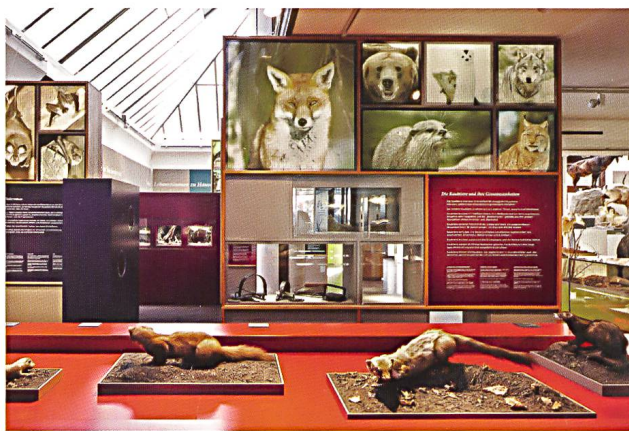
Abb. 2: Einblick in die Dauerausstellung «Säugetiere Graubündens».

Die Sonderausstellung «Lutra lutra – eine Chance für den Fischotter», eine Produktion des Bündner Naturmuseums, des Zoos Zürich und der Stiftung Pro Lutra, wurde im Berichtsjahr nirgendwo gezeigt. Das Gleiche gilt für die Sonderausstellung über die Bündner Jagd.