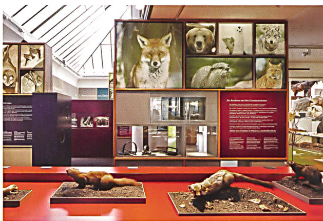
Abb. 2: Einblick in die Dauerausstellung «Säugetiere Graubündens».

Die Sonderausstellung «Lutra lutra – eine Chance für den Fischotter», eine Produktion des Bündner Naturmuseums, des Zoos Zürich und der Stiftung Pro Lutra, wurde im Berichtsjahr nirgendwo gezeigt. Das Gleiche gilt für die Sonderausstellung über die Bündner Jagd.