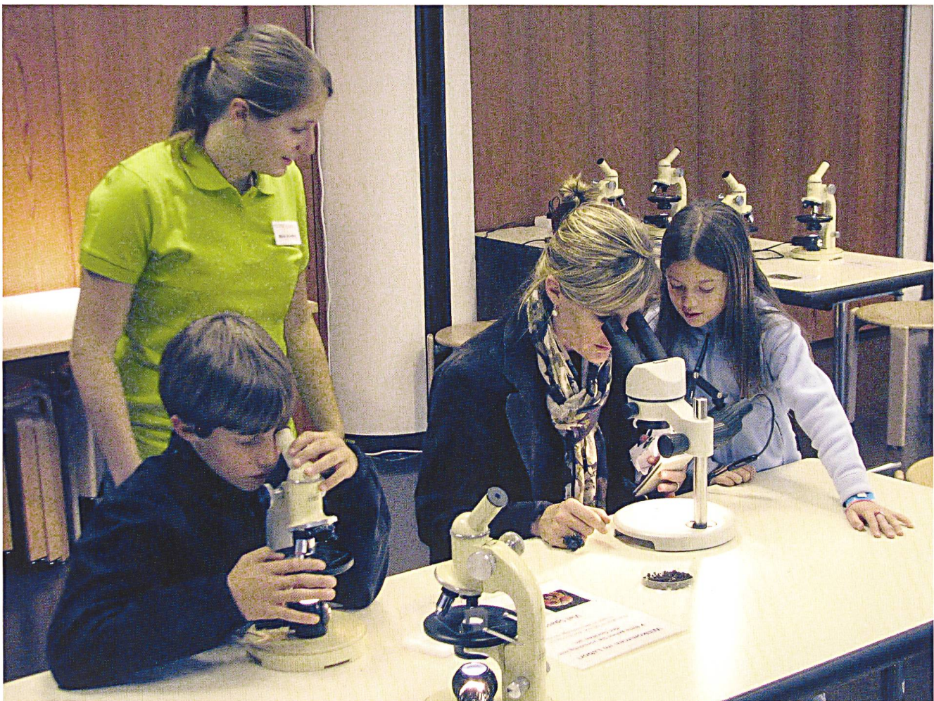
Abb. 3: Am «Langen Samstag» konnten mithilfe von Binokularen Kleinstlebewesen vergrössert und «sichtbar» gemacht werden. (Foto: BNM).