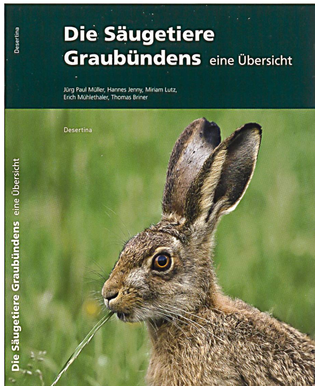
Abb. 1: Das Cover des Buches «Die Säugetiere Graubündens».

konferenz für die Vorstellung des Schlussberichtes GEO-Tag der Artenvielfalt und im Dezember für die Vorstellung des Säugetierbuchs ein. Beide Anlässe stiessen auf reges Interesse.