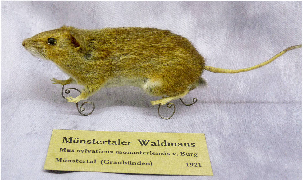
Abb. 3: Münstertaler Waldmaus ( Mus sylvaticus monasteriensis v. Burg), im Besitz des Bündner Naturmuseums mit Fundort Müstair und Datum 1921. Von Burg verkaufte das Objekt an das Bündner Naturmuseum. Die Benennung Mus sylvaticus monasteriensis v. Burg behielt von Burg nicht bei. In den Listen von 1922 und 1925 ändert er auf Alpenwaldmaus ( Mus sylvaticus alpinus Bg.).

Für die Alpenwaldmaus Mus sylvaticus alpinus Bg des Münstertales beschrieb er zwei sehr verschiedene Phänotypen (Weidmann 3: Nr. 2,7 [1921]), die er aber in der Liste von 1925 als eine Subspezies aufführt. Schon in der Liste von 1921 figurierte die Alpenwaldmaus für «Bergell und Münstertal, über 2500 m ü.M.» (VON BURG 1921 a). In dieser Liste finden sich fünf Unterarten der Waldmaus, die das breite phänotypische Spektrum der Waldmäuse im Untersuchungsgebiet aufzeigen. Aus heutiger Sicht hat von Burg die Vielfalt der Waldmäuse erkannt (wenn auch nicht als Erster), aber in einer ungeeigneten Form unter Beiziehung ausländischer Formen beschrieben (J. P. Müller, schriftl.). Bei der Schneemaus führte er 1925 eine Subspezies Microtus nivalis orientalis Bg auf, während er die noch nicht sichere Bestimmung der Guds Schneemaus Microtus gud alpestris v B. von 1921 wieder fallen liess. In seinen Protokollen grupperte er die Schneemäuse lediglich, z.B. als Bergeller oder Nationalpark-Exemplare (Brief 29.12.1921, Weidmann 4: Nr. 44, 7 [1923]). Beim Siebenschläfer und Gartenschläfer schuf er im Unterschied dazu je drei Unterarten, die er besser als Gruppen oder Formen bezeichnet hätte, da sie sich geografisch zu sehr überschneiden.