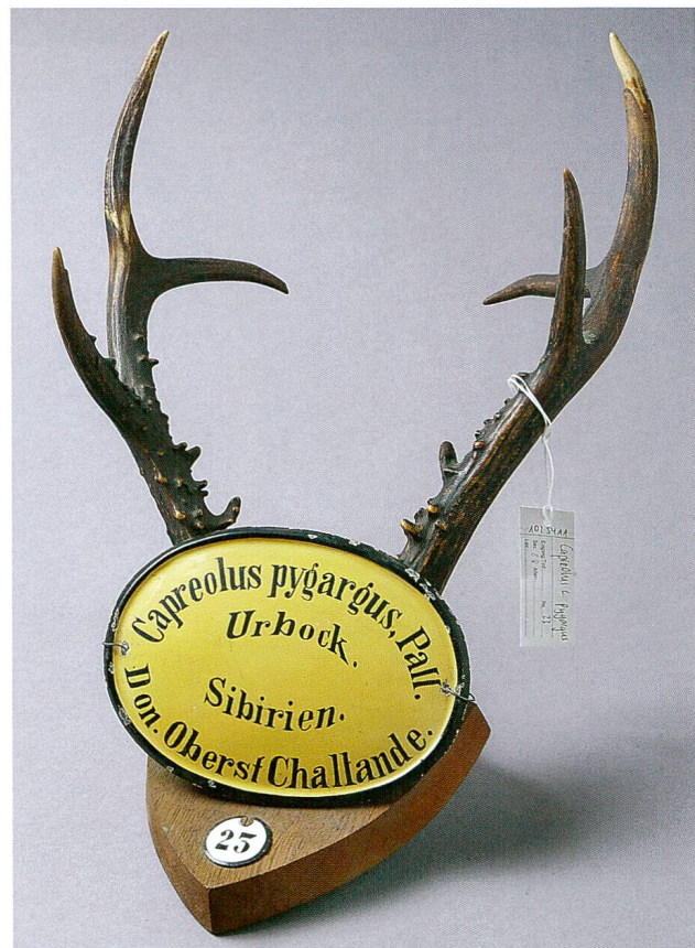
Abb. 5: Geweih des Urbocks ( Capreolus pygargus ) aus der Kollektion Challande (1840–1890), im Besitz des Naturhistorischen Museums Bern, sibirischer Herkunft.

Von Burg, der sich intensiv mit Hörnern und Geweihen befasste und auch die ca. 40 Rehgeweihe von Curdin Grass in Zernez und frisch geschossene Rehe im Engadin untersuchte, stellte auffallend starke Geweihe, nicht allzu selten Achtender, fest, die er noch vorhandenem ausgedünntem «Pygargusblut» zuschrieb. Der Urbock habe sich im Verlauf des 19. Jahrhunderts noch in Kreuzungen erhalten. Er verwies auf einen jungen Bock, der 1889 aus dem Engadin nach Pianazzolo (wohl Pianazzo südl. des Splügenpasses, Italien) herübergejagt und dort erlegt worden war (VON BURG 1921 a). Er hielt auch in der Liste von 1925 fest: «Vielleicht noch