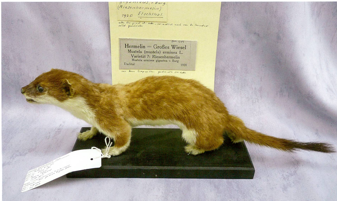
Abb. 4: Riesenhermelin ( Putorius ermineus giganteus v. Burg), im Besitz des Bündner Naturmuseums, aus dem Etschtal, datiert 1920. Von Burg verkaufte das Objekt an das Bündner Naturmuseum. In der Liste von 1922 nennt er es auf Deutsch Grossshermelin. In der Liste von 1925 wird das Etschtal nicht einbezogen, deshalb wird das Riesenhermelin dort nicht aufgeführt (Foto: Bündner Naturmuseum).