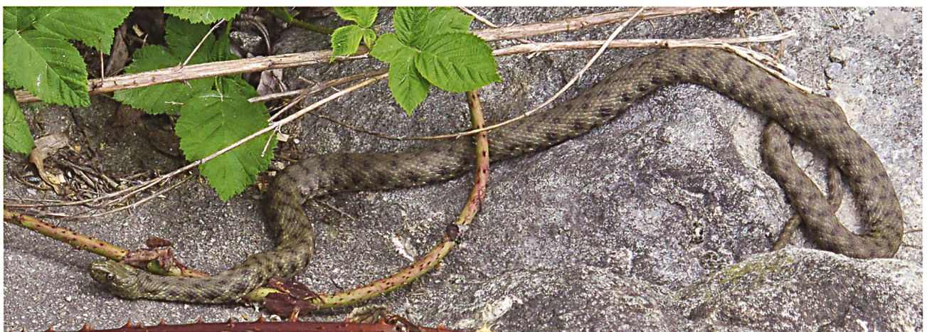
Abb. 3: Die Würfelnatter kann in Graubünden nur im Misox und im Südpuschlav beobachtet werden.

Dank zweier Teilnehmer des Reptilienkurses 2009 darf das Ringelnatter-Monitoring in Maienfeld und Jenins mittlerweile als Langzeitprojekt bezeichnet werden. Elsbeth und Roland Ungricht betreuten dieses schon im Jahr 2000 gestartete Projekt auch im 2012 wieder auf die gewohnt zuverlässige Art. Es kann von einem erfreulichen Bestand der Ringelnatter Natrix natrix helvetica gesprochen werden. Vermisst wird seit einigen Jah-