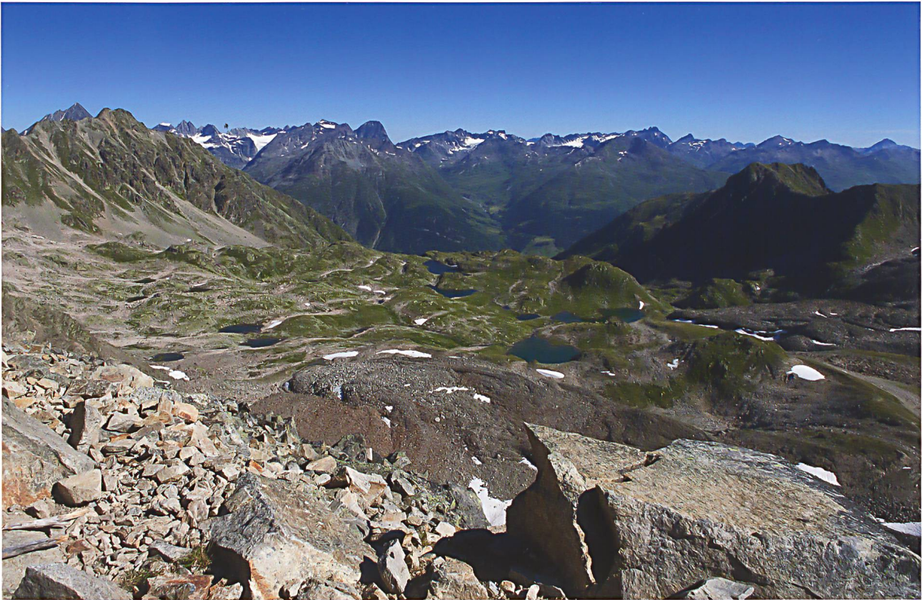
Abb. 13: Die alpine Seenplatte Macun in der Gemeinde Lavin – seit dem 1. August 2000 als Exklave Teil des Nationalparks. Beim Drachensee (Lai dal Dragun) handelt es sich um den talnächsten See – gelegen am Rand der Seenplatte. Verwiesen sei auch auf die Seiten 204/205 im Atlas von 2013.

Nationalparks» mit dem Paradoxon-Effekt, in dem Wildnis eben gerade nicht durch schaffen, nicht durch aktives Handeln erreichbar ist, sondern durch bewusstes Gewähren-lassen. Durch die Gründer war die eingeleitete Entwicklung als naturwissenschaftliches Langzeit-Experiment verstanden worden, als Verwilderungsexperiment. Wildnis im Nationalpark lässt sich damit auch als Nebeneffekt eines angesetzten naturwissenschaftlichen Experimentes einstufen. Neben der primären Wildnis, wie beispielsweise in Urwäldern oder auch Landschaften der Arktis, kann Wildnis, wie oben erwähnt, auch in einer früher durch den Menschen bewirtschafteten Landschaft entstehen – als sekundäre Wildnis oder Ziel-Wildnis – wenn das Diktat des Handels ganz der Natur zurückgegeben wurde (WEISS 1974, BROGGI 1996, 2015, BROGGI et al. 1999, HINDENLANG 2014). Die Landschaft des Nationalparks ist mit der Aufgabe der früheren Nutzung zweifellos auf dem Weg zur Ziel-Wildnis (KÖNZ 1984, PAROLINI 2012). Im Blick auf das Netzwerk der Wanderwege im Park, die zum Teil – wie in der Val Trupchun – sehr oft begangen werden, sieht man wohl in nahe und weite Flächen mit Wildnis-Charakter, aber Distanz bleibt, man steht selber da-