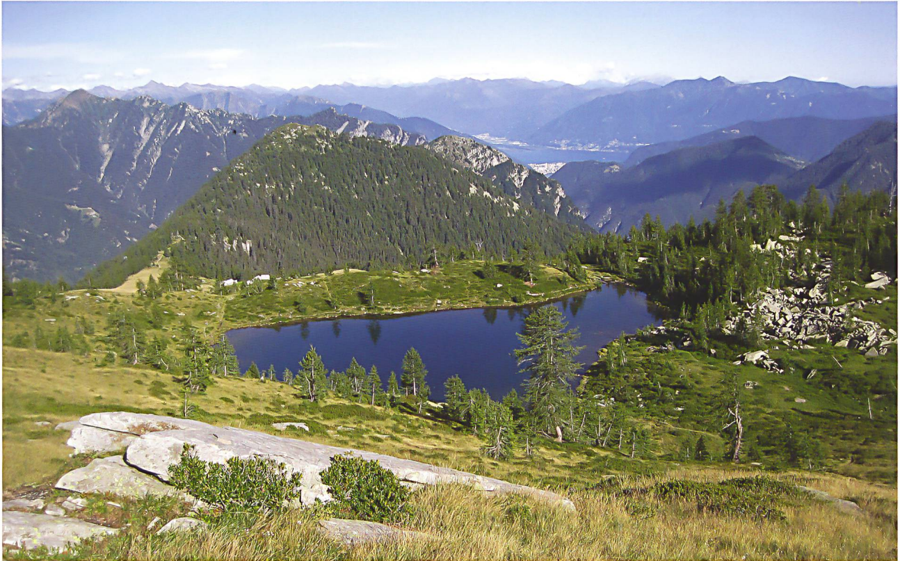
Abb. 11: Der geplante Parco Nazionale Locarnese beeindruckt mit der Vielfalt seiner Täler, mit reicher Naturwildnis, reizvollen Gewässern und die Landschaftsgeschichte spiegelnden kleinräumig strukturierten Siedlungen. Im Bild der in einer Karmulde zauberhaft gelegene Laghetto dei Saléi und der trotz 1730 Meter Höhendifferenz gar nicht so ferne Lago Maggiore (Foto: Bernhard Nievergelt).

Pärke eine Forschungsverpflichtung schon deshalb gegeben, weil die Bedeutung dieser Massnahmen überzeugend ausgewiesen werden muss. Mit den gefragten personellen und finanziellen Ressourcen ist allerdings ein begrenzender Faktor gegeben. Dennoch muss eine für alle Pärke geltende grundsätzliche Forschungsverpflichtung im Visier bleiben. Pärke leisten ihren Beitrag als Vergleichsgebiet nicht aufgrund der Parkkategorie, sondern aufgrund der langfristigen Sicherung des Schutzes, der Berechenbarkeit des Managements, der bestehenden Datenreihen und der biogeografischen Lage. Lohnend ist auch die Konsultation ausländischer Datenreihen. So ergaben sich im Falle des Wildnisparks Zürich im Sihlwald überraschende Einsichten dank Vergleichsdaten aus Naturwäldern in Osteuropa.