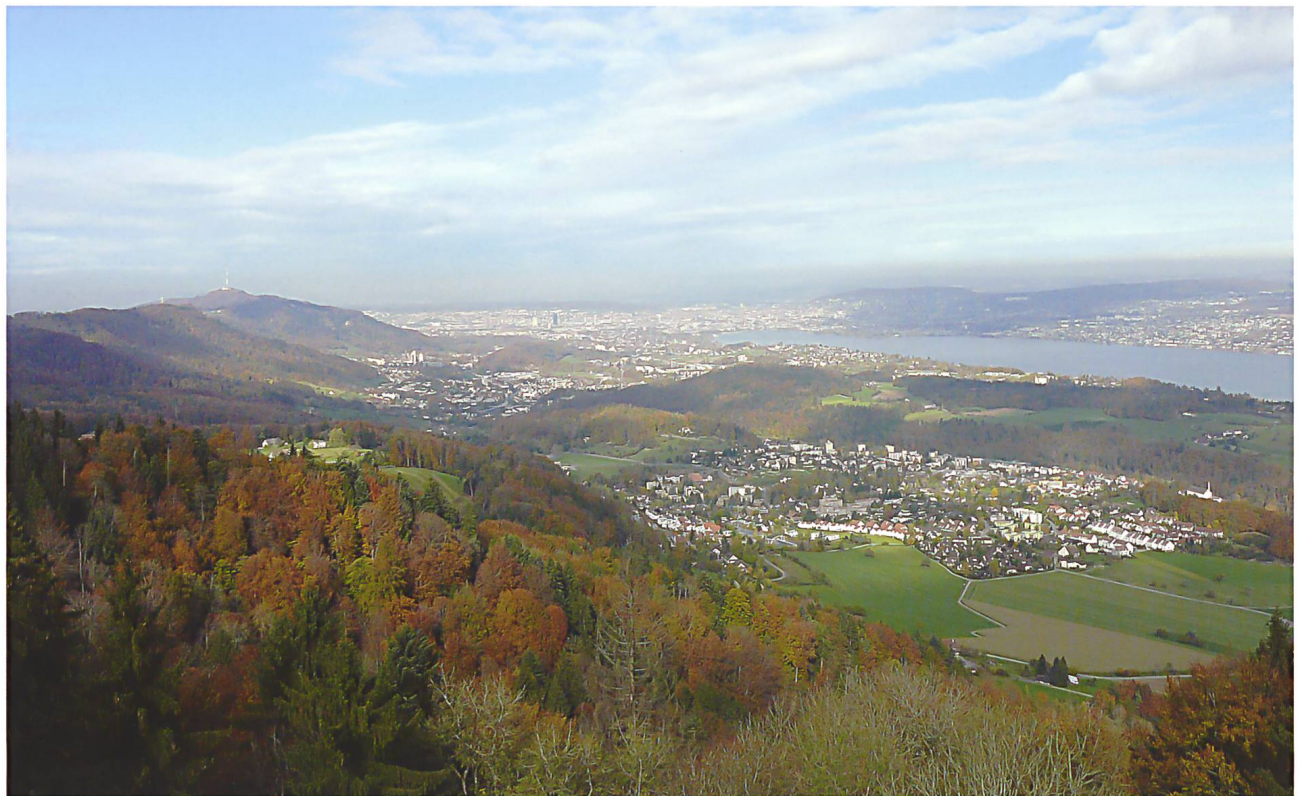
Abb. 10: Zwei national bedeutende Pärke mit – im Sinne ihrer Individualität – teilweise anderen Prioritäten. Der als national bedeutender «Naturerlebnispark» eingestufte Wildnispark Zürich Sihlwald besticht durch das Nebeneinander von Wald-Wildnis und urbanem Raum. Verstärkt wird der Kontrast durch die von Dynamik geprägte geologisch junge Landschaft des Sihltals und der Albiskette, in welcher immer wieder Rutschungen für das faszinierende Nebeneinander von Pionierflächen und stabilen Altbeständen besorgt sind.

Unverständlich scheint mir die Regelung, dass gemäss Parkverordnungen und den Richtlinien des Bundesamtes für Umwelt (BAFU) der Forschungsauftrag verbindlich sei für Nationalpärke, jedoch freiwillig für Naturpärke und Naturerlebnispärke. Nun ist mit der Schaffung eines Schutzgebietes und besonders mit dem Aufbau eines Netzwerkes der