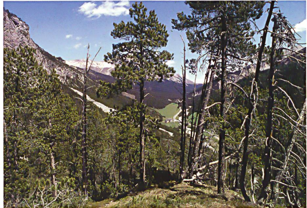
Abb. 2: Blick von Plan da la Posa ostwärts Richtung Il Fuorn. Diese Hügelkuppe aus Wettersteindolomit liegt mit ihren rundum ähnlich steilen Flanken inselartig in dem grossräumig nach Süden orientierten Hangfuss des Piz dal Fuorn. Die ökologische Bilderbuch-Offerte lud dazu ein, fachübergreifend und basierend auf für alle Experten verbindlichen Sektoren das lokale Klima, detaillierte Bodenverhältnisse und vorkommende Pflanzen zu ermitteln. Die generelle Tendenz in den Nordlagen: mächtige Humushorizonte, pH tief, hoher Deckungsgrad – Bewimperte Alpenrose und Bastard-Alpenrose, Preiselbeere, Heidelbeere, Moorbeere, Rundblättriges Wintergrün. Tendenz bei Südlagen: nur schwache Humushorizonte, pH hoch, Deckungsgrad gering – Niedrige Segge, Weisse Segge, Buchsblättrige Kreuzblume, Blaugras, Berg-Thymian, Gestreifter Seidelbast (PALLMANN, FREI 1943; BRAUN-BLANQUET et al. 1954).

Mit Bezug auf die angestrebte Zusammenarbeit muss die innere Gegensätzlichkeit zweier Wissenschaften angesprochen werden. Der analysierende Ansatz zum einen, damit der Weg zu einem tieferen Verständnis über das Zerlegen in immer kleinere Einzelteile, der synthetisierende Weg zum andern, der Versuch, ein ganzes Gefüge über das Wirken der Wechselbeziehungen zu verstehen. Beide Wege sind