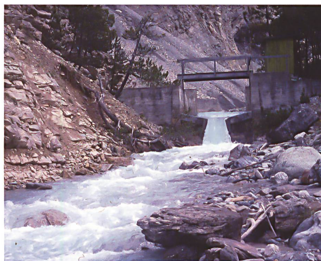
Abb. 9: Die bestehende hydrologische Messstation bei Punt la Drossa: Die hydrologische Datenreihe für das im Rahmen der Parkforschungen vielfältig untersuchte 55,3 km 2 grosse Einzugsgebiet der Messstation dürfte angesichts der Klimaänderung an Wert gewinnen. Eine naturnahe Erneuerung der Station scheint deshalb prüfenswert – trotz etwas verminderter Genauigkeit und unabhängig vom Problem der Bachforellen (Foto: Bernhard Nievergelt, 5.7.1990).

Gewässerfragen waren 1990 erstmals Thema der jährlichen fachübergreifenden Klausurtagung. Parkdirektor Schloeth hatte die Forschungskommission mit zwei Fragen darum gebeten. Die eine betraf eine allfällig zu bauende Fischtreppe bei der Hydrologi-