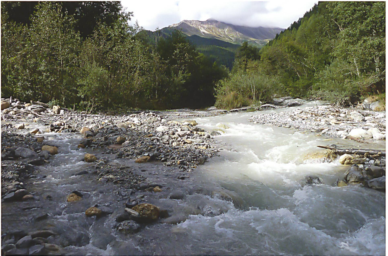
Abb. 5: Rombach: Der Haupttalfluss Rom, nach grosszügigen Aufweitungen des Flussraumes erfolgreich revitalisiert, pendelt in seinem breiten unverbauten Bachbett und bietet mit seinen Auen einen natürlichen Hochwasserschutz und ein immer wieder neues Naturerlebnis. Über den wachsenden Widerstand während der zehn Jahre dauernden Auseinandersetzungen wurde schliesslich der Nutzungsverzicht auf den Rom für die Stromproduktion erreicht (PITSCH 2003, 2014).

Ein wichtiger direkter Bezug zum Unterengadin ist gegeben mit dem verbindenden Fliessgewässernetz. Die bemerkenswerten fachübergreifenden Studien der Forschungskommission vor den Eingriffen zur Energienutzung mit 25 Einzelstudien und einer Synthese (NADIG et al. 1999) rufen – vor allem nach den späteren Revitalisierungen des Inn – nach einer vergleichenden Wiederholung.