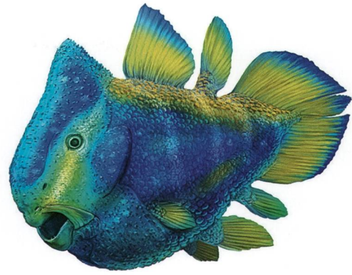
Abb. 3: Lebendrekonstruktion des neuen Quastenflossers Foreyia maxkuhni (Illustration: Scientific Reports/A. Bénétiau).

(Uster) geehrt, der in den vergangenen 14 Jahren die Präparation und Erforschung der Fossilien aus Graubünden grosszügig unterstützt hat.