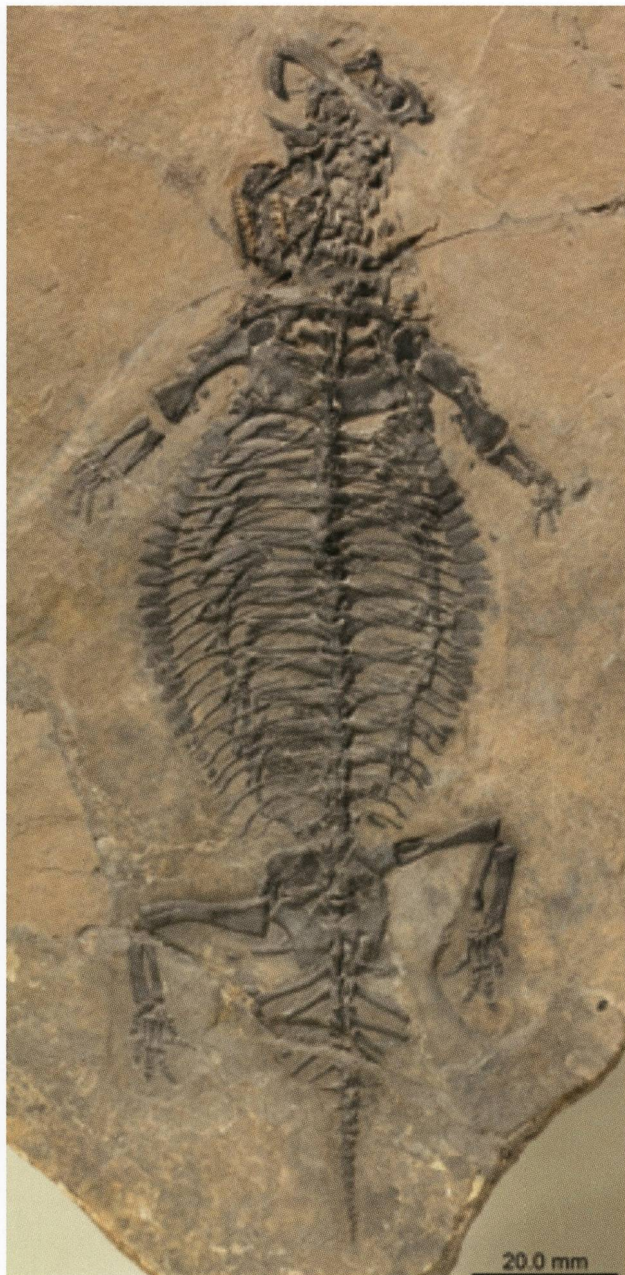
Abb. 4: Fossilplatte von Eusaurosphargis dalsassoi (Skelettlänge 17 cm; Foto: Scientific Reports/T. Scheyer).

ähnlich. Dies ist nach Ansicht der Autoren ein Fall von konvergenter Entwicklung, da die ausgestorbene Art nicht nahe mit den heutigen afrikanischen Echsen verwandt ist. Vielmehr bestätigt die genaue Überprüfung der Verwandtschaftsverhältnisse, dass es sich bei seinen nächsten Verwandten um Meeressaurier wie die Fische (Ichthyosauria), die Flossenechsen (Sauropterygia) oder auch das eigenartige schweizerische Meeresreptil Helveticosaurus handelt, die alle vom Monte San Giorgio bekannt sind. Das Skelett von Eusaurosphargis zeigt aber weder einen stromlinienförmigen Körperbau noch zu Flossen umgewandelte Arme und Beine und auch keinen Ruderschwanz. Hinweise, die auf ein Leben im Meer hindeuten würden, fehlen. Vermutlich lebte der kleine Landsaurier vor 241 Millionen Jahren auf einer Insel, wurde bei einem Sturm oder einer Überschwemmung in das Meeresbecken gespült und nach dem Tod in die fein geschichteten Meeresablagerungen eingebettet.