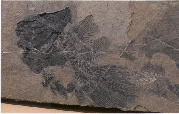
Abb. 2: Der vollständige Fund des Quastenflossers Foreyia maxkuhni (Länge 21 cm).