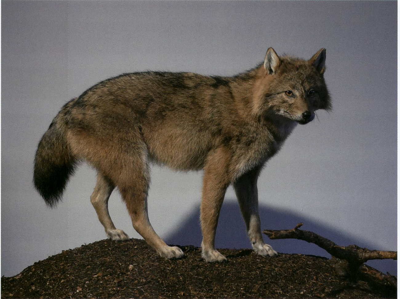
Abb. 2: Der erste und bislang einzige Goldschakal aus der Schweiz, der hierzulande in einem Naturmuseum bestaunt werden kann.

irrtümlich in der Surselva erlegt wurde (Abb. 2). Es handelte sich um den erst vierten Nachweis dieser von Osten in die Schweiz einwandernden Art und um das erste Tier aus der Schweiz, das in einem Naturmuseum zu sehen ist. Aus Anlass der Präsentation dieses Tiers wurde die Raubtiervitrine vergrössert, so dass nun sämtliche grösseren Raubtiere hinter Glas stehen.