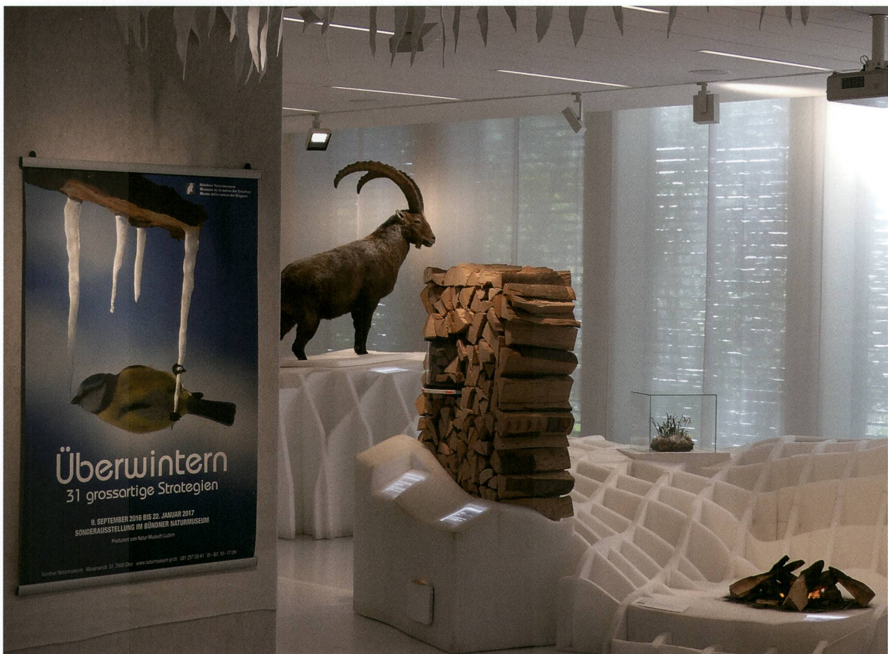
Abb. 4: Für die Sonderausstellung «Überwintern – 31 grossartige Strategien» verwandelten die Mitarbeiter den Saal in eine Winterlandschaft.