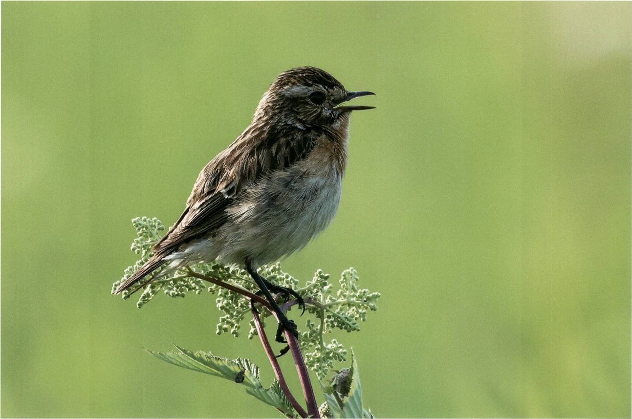
Abb. 3 : Im Mittelpunkt der Sonderausstellung «Erlebnis Wiesenbrüter» stand das Braunkehlchen (Foto: U. Rehsteiner).

ein weiterer ausserordentlicher Fund von der Dufurugga bzw. dem PIMUZ mit zwei Objekten ins Bündner Naturmuseum. Die neu beschriebene Gattung und Art ist charakterisiert durch einen grossen Kopf mit stark erhöhter Stirn, ein kleines Maul und einen extrem kurzen Körper mit kräftigen Flossen. Bezeichnend sind die quastenartige Schwanzflosse und die rundlichen Schuppen mit Hohlstacheln. Die Körperform deutet darauf hin, dass der Davoser Quastenflosser nicht wie sein berühmter heutiger Nachfahre Latimeria im tiefen Wasser lebte, sondern Flachwasserbereiche bevorzugte. Die eigenartige Körperform weist erstmals auf abweichende Formen in der sonst relativ starren Evolutionslinie zu den heutigen Quastenflossern hin, die auch als «lebende Fossilien» bezeichnet werden. Auch diese beiden Objekte wurden vom engagierten Amateurpaläontologen Christian Obrist entdeckt.