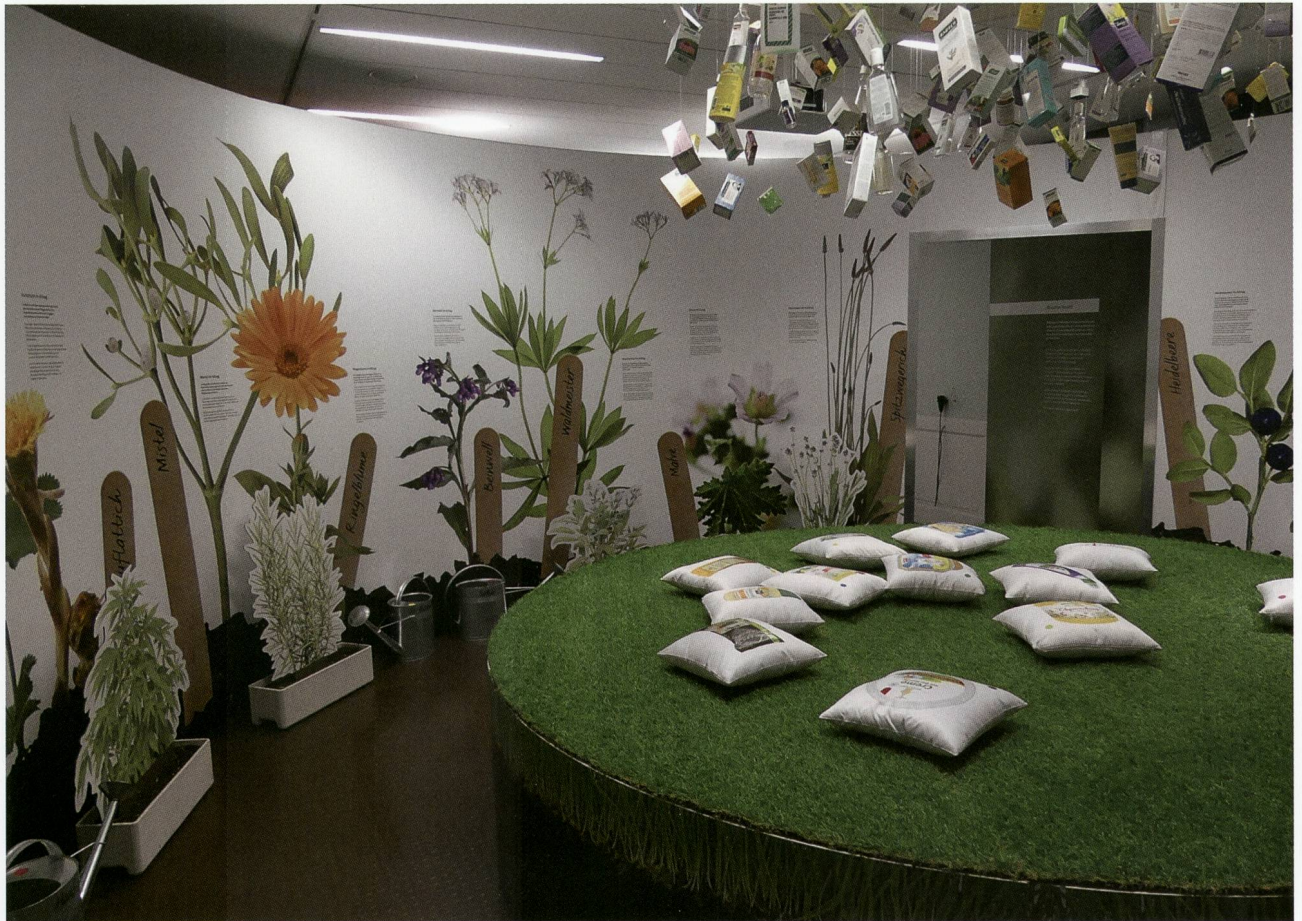
Abb. 4 : In der Ausstellung «Wohl oder Übel» drehte sich alles um die teilweise jahrhundertalte Nutzung von Kräutern, die auch heute noch in vielen Produkten zu finden sind.