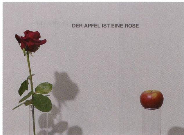
Abb. 3: In der Sonderausstellung «Der Apfel – Ein besonderes Früchtchen» stand für einmal eine Kulturpflanze im Mittelpunkt (Foto: Bündner Naturmuseum).

«Lutra lutra – Eine Chance für den Fischotter» gastierte im Infozentrum Eichholz in Wabern, Bern, und anschliessend im Natur-Museum Luzern. «Wunderwelt der Bienen» war bis April im Naturmuseum Solothurn, ab November im Naturmuseum Winterthur zu besichtigen. Die Ausstellung «Phänomen Bündner Jagd» wurde von Juni bis Oktober entlang der Luftseilbahn Arosa–Weisshorn gezeigt.