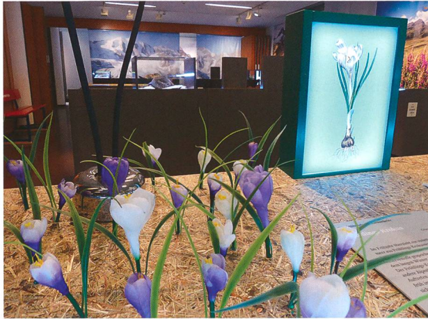
Abb. 1: Die Ausstellung «Gipfelstürmer und Schlafmützen – Tiere und Pflanzen im Gebirge», eine Eigenproduktion, war ab Mitte April 2019 bis Januar 2020 zu besichtigen.