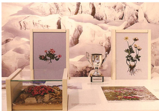
Abb. 3: Gegenblättriges Steinbrech und Gletscher-Hahnenfuss, zwei wahre Gipfelstürmer.

Waldgrenze (Abb. 1 bis 3). Auf einem Wanderweg steigt man von der Alp Tavaun (romanisch für Hummel) auf 1800 m ü.M. über das Hotel Alpendohle und das Munggenjoch hinauf zum Piz Crusch auf 3000 m ü. M. Unterwegs begegnen die Besucherinnen und Besucher ausgewählten Arten, einige davon zumindest dem Namen nach allgemein bekannt (z. B. Krokus, Bartgeier, Murmeltier), von anderen hingegen dürfte die Mehrzahl der Gäste kaum je gehört haben (z. B. Bärtierchen, Gletscher-Glasschnecke oder Gewimperte Nabelflechte). Die Mischung von (vermeintlich) Bekanntem und Unbekanntem kam beim Publikum sehr gut an, wie zahlreiche Einträge ins «Gipfelbuch» zeigten. Mit Augen, Gehör und Tastsinn liess sich überall Neues entdecken. Damit erfüllte die Ausstellung auch unseren Anspruch, auf die Naturschätze vor der Haustür aufmerksam zu machen und für die Bedeutung, aber auch Verletzlichkeit alpiner Naturräume zu sensibilisieren.