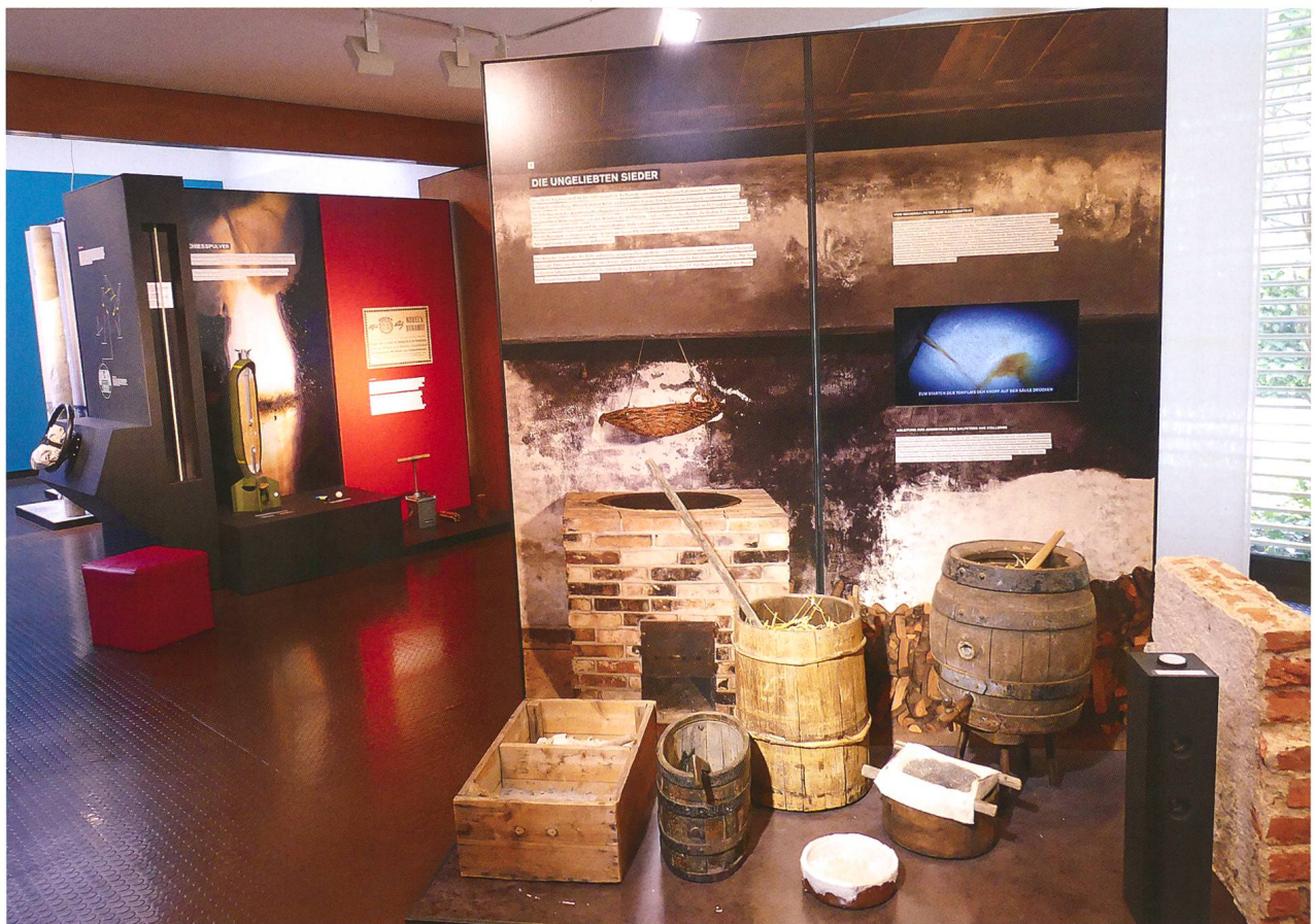
Abb. 2: Die Ausstellung «Grüner Klee und Dynamit – Der Stickstoff und das Leben» thematisierte biologische Aspekte, aber auch die gesellschaftliche und politische Bedeutung von Stickstoff.

Die Ausstellung «wild auf Wald» lud vom 13. September 2018 bis 20. Januar 2019 zu einem Spaziergang durch den Wald ein (Abb. 3). Der Wald ist ein dominierender Lebensraum Graubündens und der Schweiz. Er steckt voller Überraschungen, die zu entdecken die Ausstellung anregte. Da das Thema auch in den Schulen prominent behandelt wird, führten Flurin Camenisch und Praktikantin Stephanie Hosie fast im Dauerbetrieb Klassen durch die Ausstellung. Am 28. Oktober 2018 entführte Caroline Capiaghi Kinder und Erwachsene anlässlich der 2. Märchen- und Sagentage Chur ins Reich der Bäume (Abb. 4; vgl. auch Kapitel 6). Regierungsrat Dr. Jon Domenic Parolini hielt am 30. Oktober 2018 den Vortrag «Vom Kahlschlag zum Naturreservat – Zur Waldnutzungsgeschichte im Engadin, mit besonderem Augenmerk auf das Gebiet des heutigen Schweizerischen Nationalparks». Erstellte wurde die Ausstellung vom Naturama Aargau.