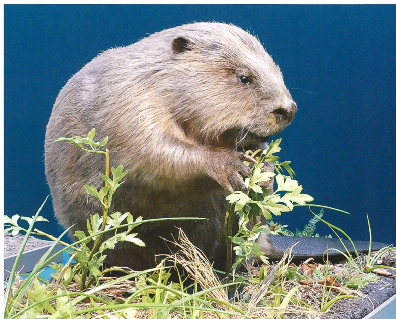
Abb. 1: Ein neu präparierter Biber aus der Schweiz ersetzt den historisch wertvollen «Elbebiber» in der Dauerausstellung.

Das spezielleste neue Objekt in den Ausstellungen ist sicherlich ein Pazifikaucher, der Ende 2015 auf dem Silvaplannersee (Lej da Silvaplauna) tot geborgen wurde, nachdem er in den Tagen zuvor von unzähligen Interessierten bestaunt worden war. Diese Vogelart brütet in der Tundra Nordamerikas und Ostsibiriens und überwintert normalerweise im Pazifikraum. Vereinzelt wurden in Europa schon Tiere an der Atlantikküste festgestellt, jedoch noch nie im Binnenland. Wie und warum der Pazifikaucher den Weg ins Engadin