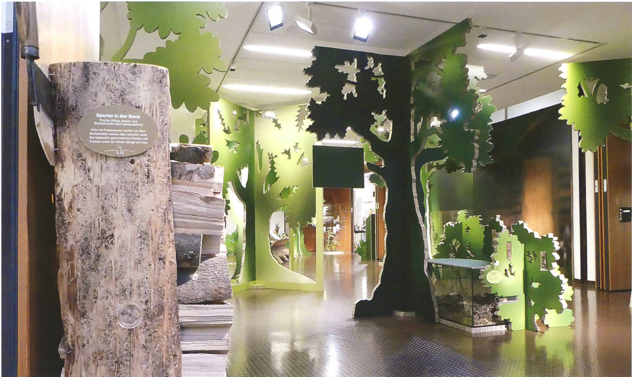
Abb. 3: Die Ausstellung «wild auf Wald» lud zu einem informativen Waldspaziergang ein.