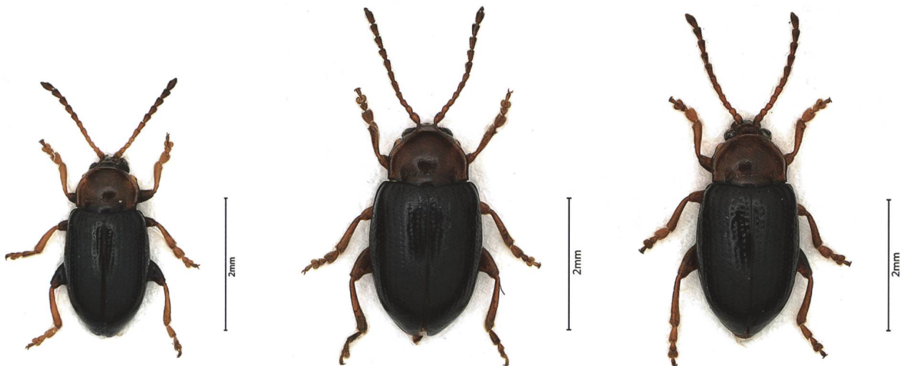
Abb. 3: Drei Arten der Blattkäfer-Gattung Neocrepidodera : von links N. melanostoma , N. rhaetica und N. spectabilis . Ohne Genitalpräparate sind vor allem die beiden letzten nicht zu unterscheiden.

net werden, wovon sechs Arten neu für die Alp Flix sind (Tab. 7). Besonders erwähnenswert ist die Marienkäferart Ceratomegilla rufocincta (Abb. 4). Dieser Käfer kommt in alpinen bis hochalpinen Habitaten vor und wird nur selten gefunden. Mittels Aktivfang wurden in den Schweizer Alpen einzelne Individuen unter Steinen gefunden (pers. Mitteilung Andreas Sanchez). Zur Biologie dieser Art ist bis heute nur sehr wenig bekannt. Die Kurzflügeldeckenkäfer-Art Anthophagus alpinus alpinus ist in der alpinen Stufe relativ oft anzutreffen. Diese Art fällt durch ihren kräftigen Kopf, und bei den Männchen durch die spitz nach vorne gerichteten Kopfanhänge, auf (Abb. 5).