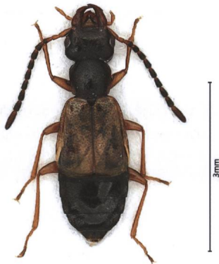
Abb. 5: Ein Männchen von Anthophagus alpinus alpinus mit den eigenartigen, nach vorne gerichteten Kopffortsätzen.