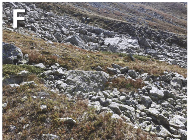
Abb. 1: Untersuchungsstandorte entlang des Transekts. A: Standort 1, Fallen im Grün-Erlen-Gebüsch; B: Standort 2, Fallen im Spritzbereich des Bachs, feuchter Standort; C: Standorte 3 und 4, Zwergstrauch-Heide. Standort 3 etwas flacher mit mehr Rhododendron; D: Standort 5, im Einflussbereich des Bachs; Fallen in dichter, hoher Vegetation, aber auch im kurzrasigeren Bereich (im Bild links); E: Standort 6, Gebirgsmagerassen, Schafläger; F: Standort 7, Geröllflur, eine Falle im reinen Geröll.