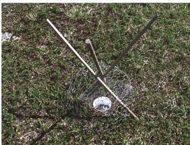
Abb. 2: Bodenfallentyp mit weissem Fangbecher und Schutzgitter gegen Wirbeltiere und mit eingepasstem, transparentem Dach gegen Regen.