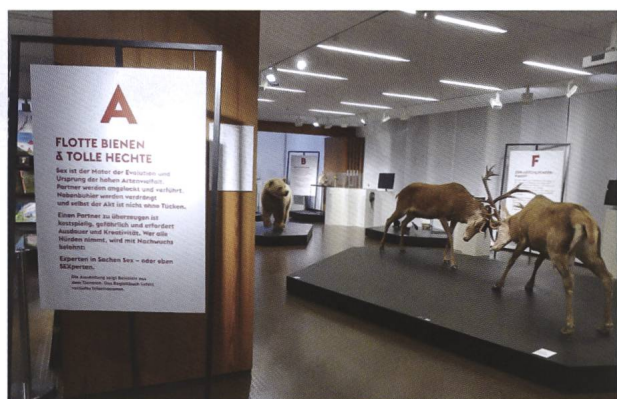
Abb. 4: Die Sonderausstellung «SEXperten – Flotte Bienen und tolle Hechte» gab einen faszinierenden Einblick in die Fortpflanzung im Tierreich. Leider konnte sie im Berichtsjahr nur einen Monat besichtigt werden.

Die Sonderausstellung «SEXperten – Flotte Bienen und tolle Hechte», produziert vom Amt für Umwelt Liechtenstein und dem Liechtensteinischen Landesmuseum, informierte über Partnerwahl und Fortpflanzung im Tierreich (Abb. 4). Zwar konnte die Vernissage am 4. November 2020 planmässig durchgeführt werden, doch ab dem 5. Dezember musste das Bündner Naturmuseum für den Rest des Jahres (und bis Ende Februar 2021) seine Tore erneut schlies-