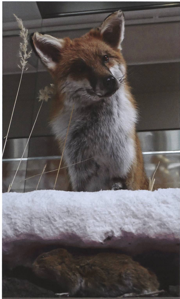
Abb. 1: Der neue Fuchs mit Schermaus ist ein Bijou in den Ausstellungen (Foto: BNM).

In den Dauerausstellungen wurden bisherige Objekte ersetzt oder restauriert, die qualitativ (insbesondere als Folge des Ausbleichens) nicht mehr den Ansprüchen genügten. Ein Bijou ist ein Fuchs in winterlichem Ambiente, der durch die Schneedecke eine Schermaus ortet. Der Fuchs hat die Maus gehört, kann sie aber nicht sehen. Dies im Unterschied zum Betrachter, der beide Tiere gleichzeitig sehen kann (Abb. 1).