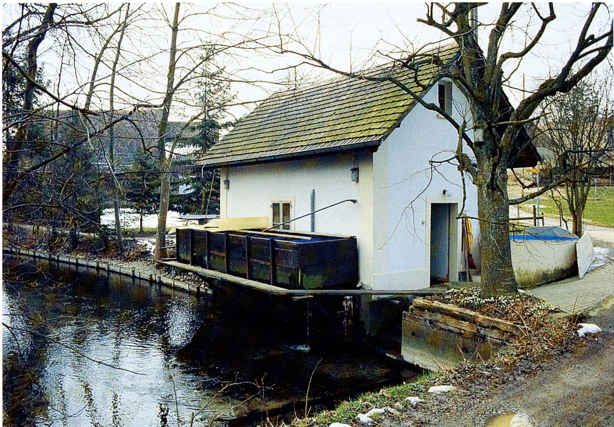
Abb. 6: Bruthaus am Auslauf der Suhre bei Oberkirch. Seit 1930 werden hier Fische gezüchtet.

Staat Luzern 2/5 des Sempachersees (mittlerer Teil)