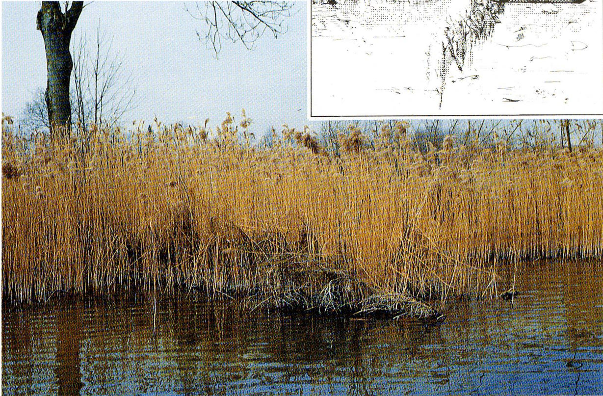
Abb. 2: Der Hechtfang mit der Bäre wurde vor allem in der ersten Hälfte des 20. Jahrhunderts praktiziert. Die Fische wurden entlang von Wänden aus Schilf und Tannästen vom Ufer weg in eine Reuse (Bäre) geleitet.