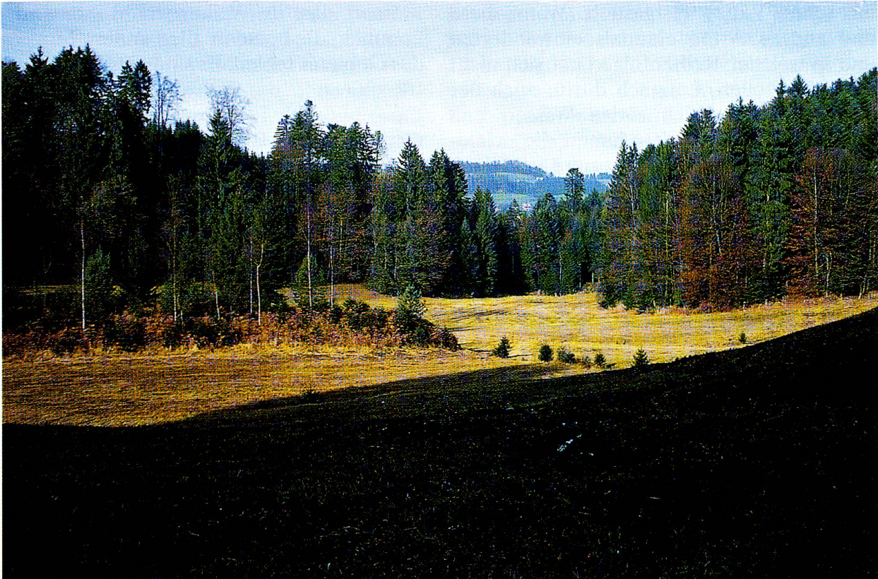
Weiherried, Blick nach Norden.

Von Interesse ist sicher die über 140 Jahre dauernde Sukzession in der Wiederbesiedlung des freigelegten Teichbodens. FRÜH (FRÜH, J. & SCHRÖTER, C. 1904), der das Gebiet am 6. Juli 1896, rund 40 Jahre nach der Aufgabe des Teiches, beging, schreibt: «Er ist entleert, voll Schilfrohr, Seggen und Tristenstangen. Die höheren oberen Ränder der Böschungen sind von Adlerfarn besetzt.» Obwohl sich die Pflanzengesellschaften der Röhrichte und Grossseggensümpfe ( Phragmitetea ), evtl. auch der Pfeifengraswiesen ( Molinio-Arrhenatheretea ) (Tristenstangen) schon eingestellt hatten, fand WOLFF 77 Jahre später immer noch die drei Pioniere überschwemmter und trockenfallender Schlammböden. Heute ist die Durchwurzelung der Schlammsschicht mit Schilf im Bereich des ehemals tiefen Wassers und mit Grossseggen im Bereich des mittleren Wassers schon so weit fortgeschritten, dass nur noch in Damm-Nähe bestenfalls handtiefe