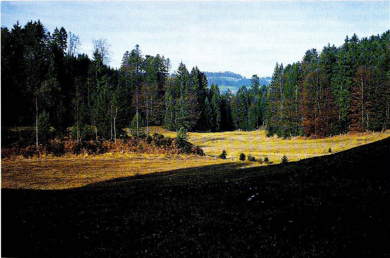
Weiherried, Blick nach Norden.

Von Interesse ist sicher die über 140 Jahre dauernde Sukzession in der Wiederbesiedlung des freigelegten Teichbodens. FRÜH (FRÜH, J. & SCHRÖTER, C. 1904), der das Gebiet am 6. Juli 1896, rund 40 Jahre nach der Aufgabe des Teiches, beging, schreibt: «Er ist entleert, voll Schilfrohr, Seggen und Tristenstangen. Die höheren oberen Ränder der Böschungen sind von Adlerfarn besetzt.» Obwohl sich die Pflanzengesellschaften der Röhrichte und Grossseggensümpfe ( Phragmitetea ), evtl. auch der Pfeifengraswiesen ( Molinio-Arrhenatheretea ) (Tristenstangen) schon eingestellt hatten, fand WOLFF 77 Jahre später immer noch die drei Pioniere überschwemmter und trockenfallender Schlammböden. Heute ist die Durchwurzelung der Schlammsschicht mit Schilf im Bereich des ehemals tiefen Wassers und mit Grossseggen im Bereich des mittleren Wassers schon so weit fortgeschritten, dass nur noch in Damm-Nähe bestenfalls handtiefe