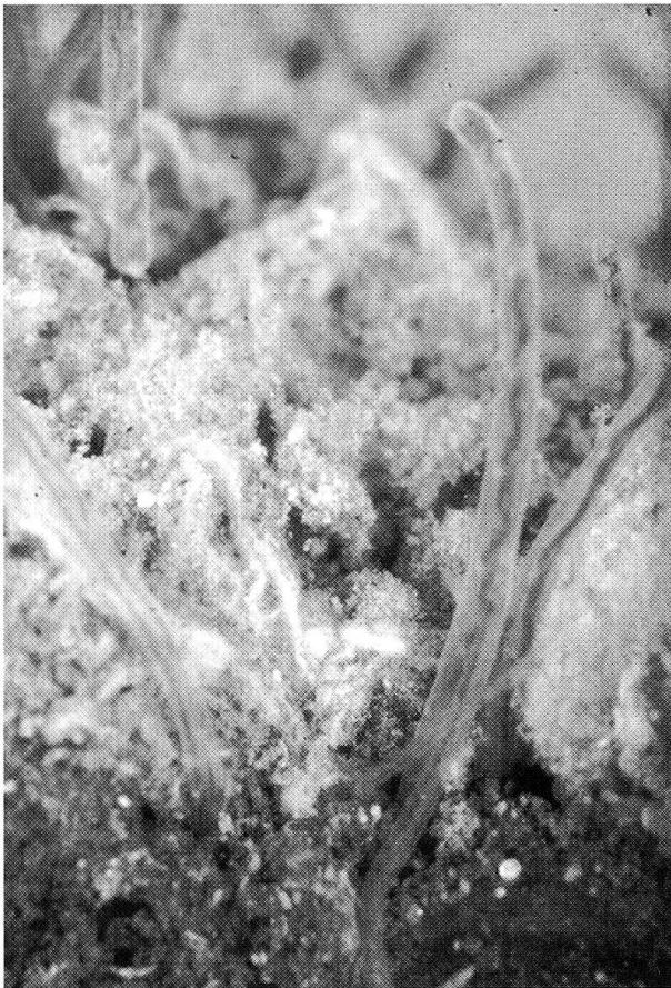
Abb. 3: Der Hinterteil der Schlammröhrenwürmer ragt ins freie Wasser hinaus. Sie atmen auf zweierlei Weise: Wasser wird in den Enddarm aufgenommen, die stark durchblutete Darmwand entzieht dem Wasser Sauerstoff. Zugleich kann Sauerstoff von aussen her durch die Körperoberfläche ins hämoglobinhaltige Blut gelangen. Durch pendelnde Bewegungen wird die Körperoberfläche permanent mit frischem Wasser und somit mit Sauerstoff versorgt.