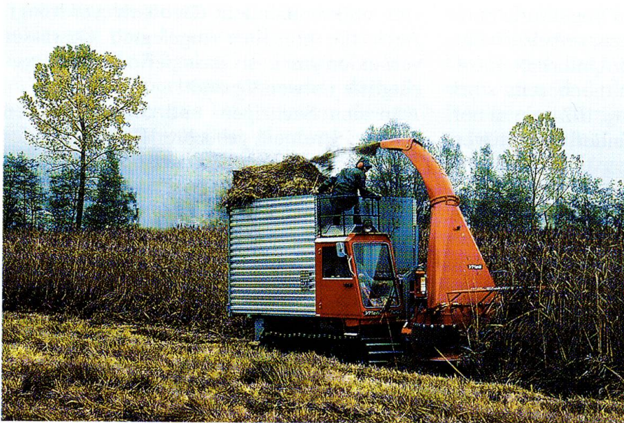
Abb. 4: Ein grosser Teil der Riedflächen wird seit 1978 mit dem Rau-entzweier gepflegt. Foto November 1990.

land gute Erfahrungen mit dieser Methode gemacht worden. Doch die Arbeit erwies sich als äusserst aufwendig und mühsam. Die Arbeiter sanken im Schlamm knietief ein und ermüdeten deshalb rasch. Auch hielten die Maschinen den grossen Belastungen nicht lange stand. 1970 versuchte man das Schilf mit Hilfe von Höckerschwanen zurückzudrängen. Ein Weiher wurde eingezäunt und dort vier Schwäne gehalten. Tatsächlich ernährten sich diese Vögel vom spriessenden Schilf. Doch bald wurden sie von Spaziergängern mit Küchenabfällen gefüttert, so dass sie kaum noch Schilf frassen (SCHIFFERLI 1973). Bereits 1971, neun Jahre nach dem Bau, waren die Weiher derart stark verlandet, dass sie teilweise wieder ausgebaggert werden mussten. Dies geschah mit einem Schaufelbagger, der jedoch nur die nördliche Hälfte der ehemaligen Wasserfläche erreichen konnte.