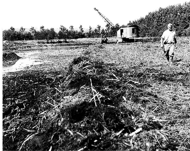
Abb. 2: 1962 erstellte die Schweizerische Vogelwarte erstmals künstliche Weiher im Wauwiler Moos (Foto Schweizerische Vogelwarte, August 1962).

Bis 1960 schrumpfte die Bodenmächtigkeit um rund einen Meter, so dass etwa 34 ha nicht mehr voll landwirtschaftlich nutzbar waren (HEGGLI 1961). 1957 richtete die Schweizerische Vogelwarte Sempach an den Regierungsrat des Kantons Luzern das Gesuch, erneut ein mindestens sechs Hektaren grosses Schutzgebiet zu schaffen. Diesmal wurde nicht mehr mit dem Schutz der Tiere vor der Verfolgung argumentiert, sondern mit dem Verlust an Lebensraum, den es aus-