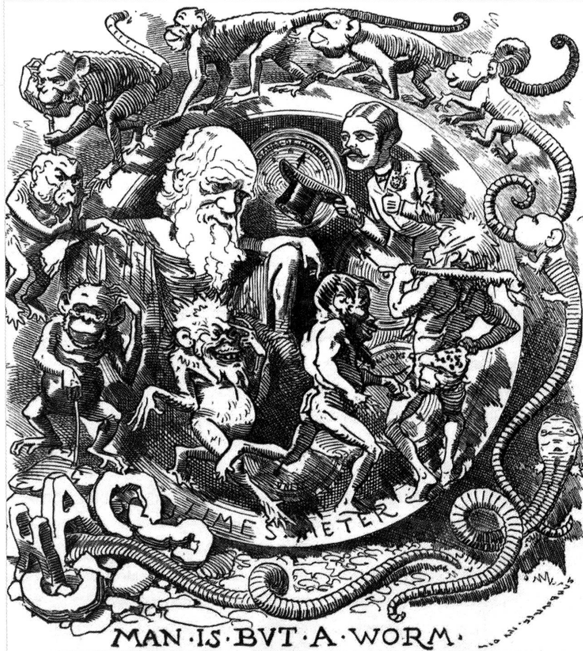
Abb. 1: Satirische Darstellung der Evolution aus dem 19. Jahrhundert.