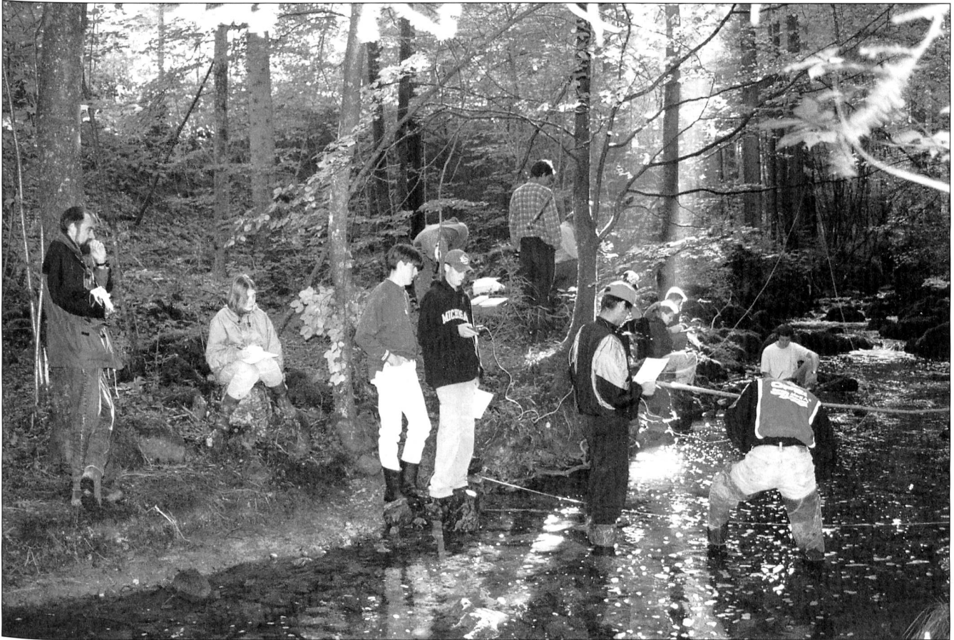
Schüler bei Tracerversuch und Flügelmessung; links: NGS-Präsident als stiller Beobachter

ten und Abflüsse im Grundwasser oder in Fließgewässern ermittelt werden.