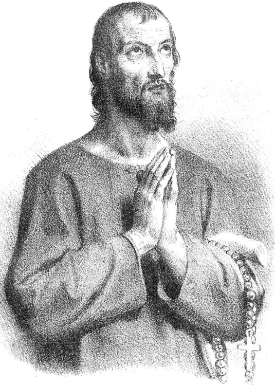
Bild des seligen Bruder Klaus und dessen Betrachtungstafel.

Mein Herr und Gott, nimm alles von mir, Was mich hindert zu Dir; Mein Herr und Gott, gib alles mir, Was mich fördert zu Dir; Herr, nimm mich mir und gib mich Dir, Und mach mich ganz zu eigen Dir.