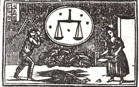
Fahrmärkte im Herbstmonat. (Fortsetzung.)

37. Sonnt. Vom Wasserfüchtigen. Lut. 14. 5 16 Viktorinus Mont. 6 Magnus A. Dienst. 7 Regina J. Mittw. 8 Maria Geburt Donnst. 9 Gorgon, Corb. Freitag 10 Nikol. v. Tol. Samst. 11 Felix u. Regula