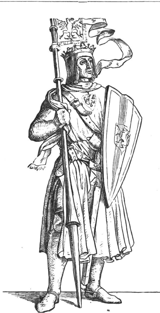
König Rudolph von Habsburg.

vorgedrückt war. 'S war so rechtes Sudelwetter, empfindlich kalt und der Himmel zeigte mehr Lust zum Schneien als zum Regnen. Eines Morgens war König Rudolph, seiner Gewohnheit gemäß, ziemlich früh aufgestanden. Er froz nicht wenig, denn das Zimmer war nicht geheizt, aus dem einfachen Grunde, weil es keinen Ofen hatte. Fröstelnd schaute er zum Fenster hinaus und bemerkte, daß seiner Herberge gegenüber ein Bäckerhaus stand, in dem schon alles vollauf beschäftigt war. Dem König kam der Gedanke sich da drüben am Kohlenfeuer zu erwärmen. Gedacht, gethan! — Um nicht erkannt zu werden, kleidete sich Rudolph in einen ganz gewöhnlichen Leibrock, wie ihn unbemittelte Dienst-