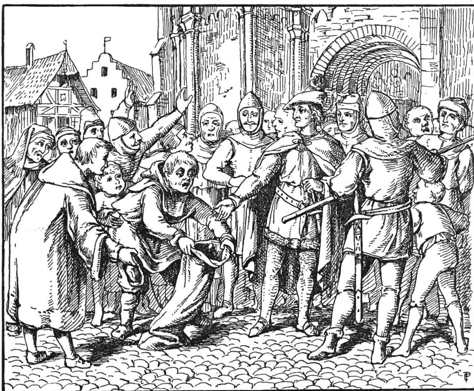
König Rudolph und der Schalksnarr.

Er war in 14 Schlachten Sieger, hatte viele Herren und Städte bezwungen, die sich vorher nie einem römischen König unterwerfen wollten. Er beehrte nicht nach Rom zu ziehen, um die kaiserliche Krone zu empfangen, obwohl ihm dabei nichts im Wege stand. Seines Hauses Erbe hinterließ er reich und mächtig seinem Sohne Albrecht. König Rudolph wurde